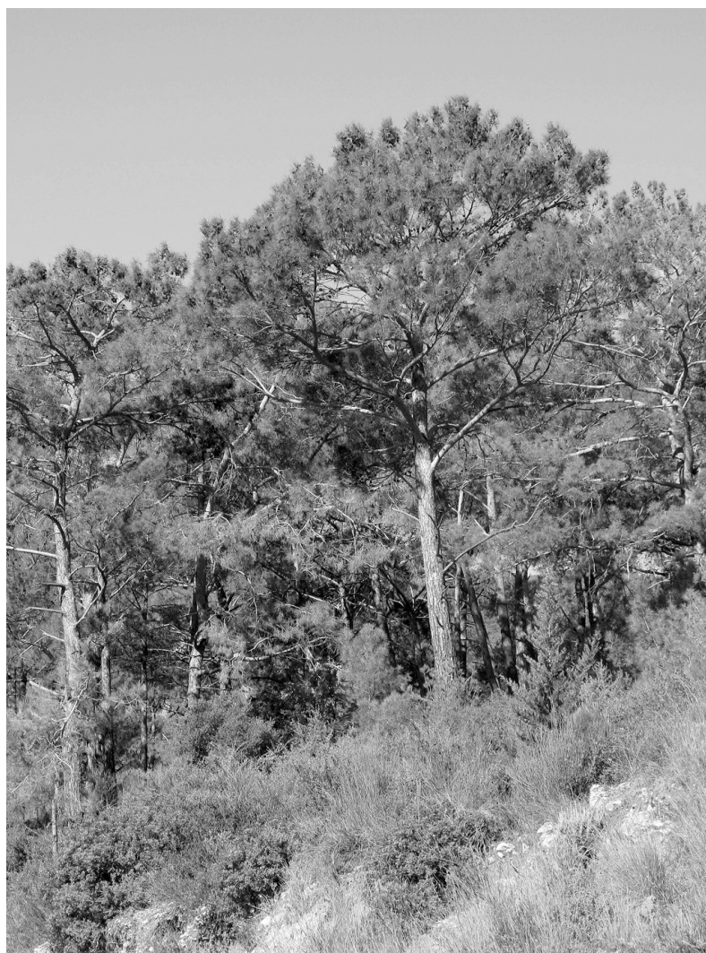
Photo 2 : Peuplement de pin brutia en Turquie dans la région d'Antalya

Dans ces peuplements, le Pinus brutia constitue l'étage dominant et le Quercus calliprinos l'étage dominé. C'est une futaie de pins sur taillis de chêne. Le traitement de ces peuplements doit être orienté dans l'ob-