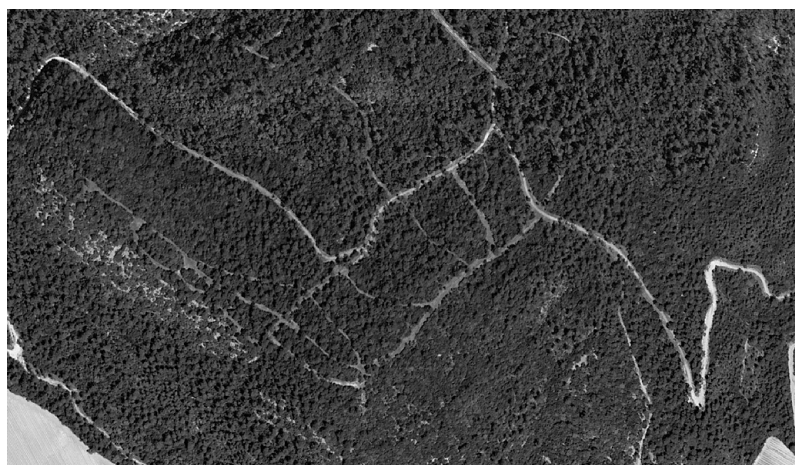
Photo 2 : Vue aérienne d'un secteur du Domaine de Cécéles aménagé pour la chasse à la bécasse, où la densité de linéaire créé dépasse 100 ml/ha.

Ce secteur de la propriété est largement fréquenté par les sangliers et les bécasses, qui y trouvent les faciès de végétation idéaux pour leurs remises diurnes.