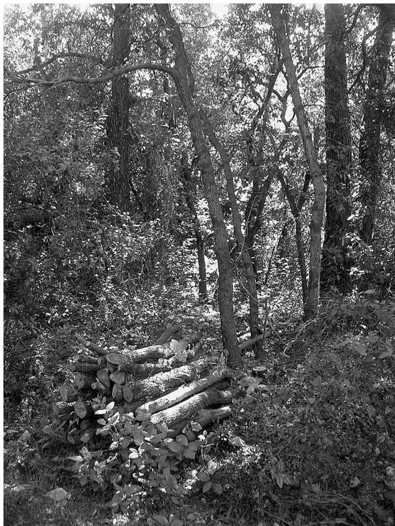
Photo 3 (ci-contre) : Aspect du taillis de chêne vert après exploitation

Le mode opératoire retenu a pour objectif de minimiser les perturbations, de favoriser la croissance des plus belles tiges, de conserver la diversité d'essences (chêne blanc, arbousier, filaire) et de conserver la strate arbustive.