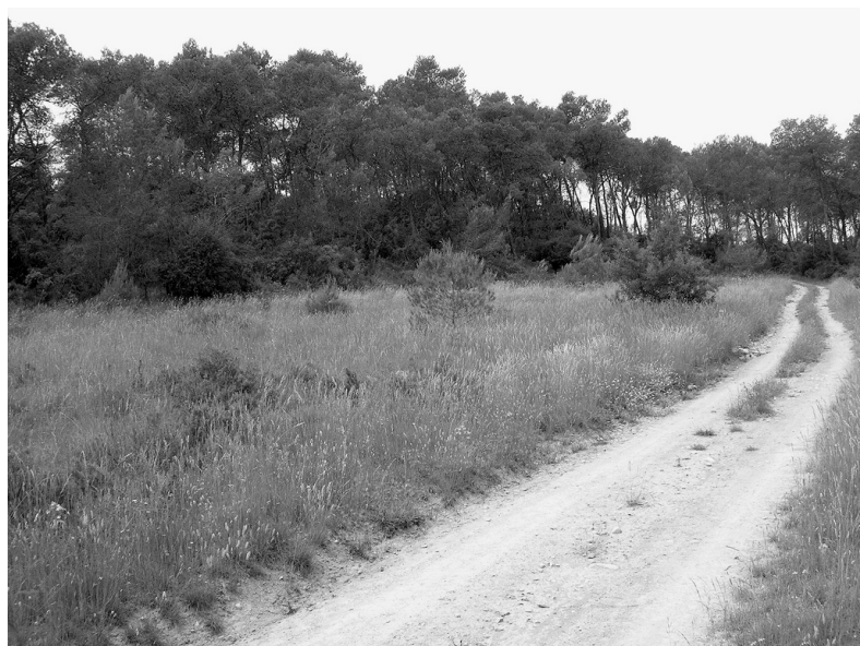
Photo 4 (ci-dessous) : Secteur favorable au lapin sur le Domaine de Cécéles

A l'opposé, dans le contexte d'une propriété privée "banale", le forestier ne dispose la plupart du temps d'aucune donnée concernant la richesse écologique d'un site. Ici, la protection des habitats et des espèces n'est pas une obligation réglementaire, mais relève d'un choix de gestion. Dans ce contexte, les moyens financiers sont de plus généralement limités.