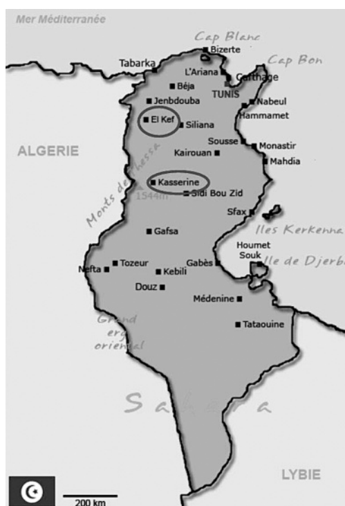
Tab. I (ci-dessus) : Caractéristiques climatiques des régions du Kef et de Kasserine