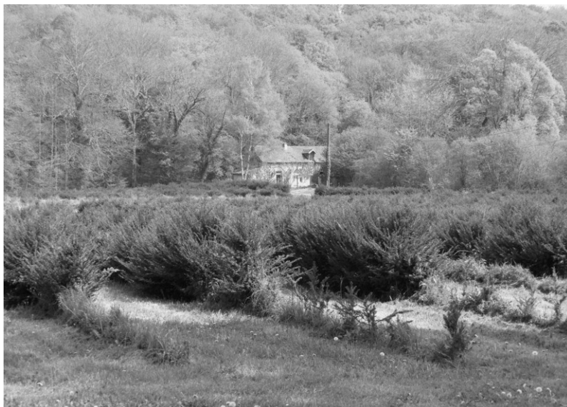
Photo 1 : Culture médicinale d'if (un peu délaissée aujourd'hui) dans une abbaye en Bourgogne. L'if ( Taxus baccata ), utilisé au moyen âge comme poison, est reconnu aujourd'hui pour ses propriétés anticancéreuses.

– les tanins, la gomme ou l'isoprène sont également des molécules à potentiel. La gomme est utilisée par exemple dans la production d'essence de térébenthine et de colophane, l'isoprène dans la constitution de caoutchouc de synthèse ou naturel ; les tanins sont utilisés dans la maturation du vin, la coloration de peaux, la préservation ou l'industrie pharmaceutique. Les tanins permettent également de valoriser les écorces et peuvent se substituer pour la préparation de résines et d'adhésifs. Leur polymérisation permet d'obtenir des mousses rigides ou des gels solides aux propriétés remarquables : légèreté, résistance mécanique élevée, coût de revient bas, infusibilité, complète inflammabilité et conductivité thermique basse pour les premières, légèreté, coût de revient bas, absence d'irritation, opacité, conductivité électrique et capacités d'isolation pour les seconds. Les applications de ces dérivés sont donc nombreuses : les mousses rigides peuvent être utilisées dans le transport, l'emballage, la marine, l'aéronautique, l'automobile, l'électronique, la construction, l'isolation, etc. quand les gels