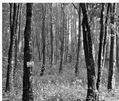
Plantation de oud, connu aussi sous le nom de bois d'agar ou bois d'aloès. C'est le bois le plus cher du monde. L'arbre n'a de valeur que s'il est infecté par un champignon, il produit alors une résine très recherchée.