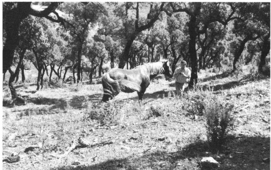
Photo 20 : Essai de pâturage par des chevaux de la suberaie