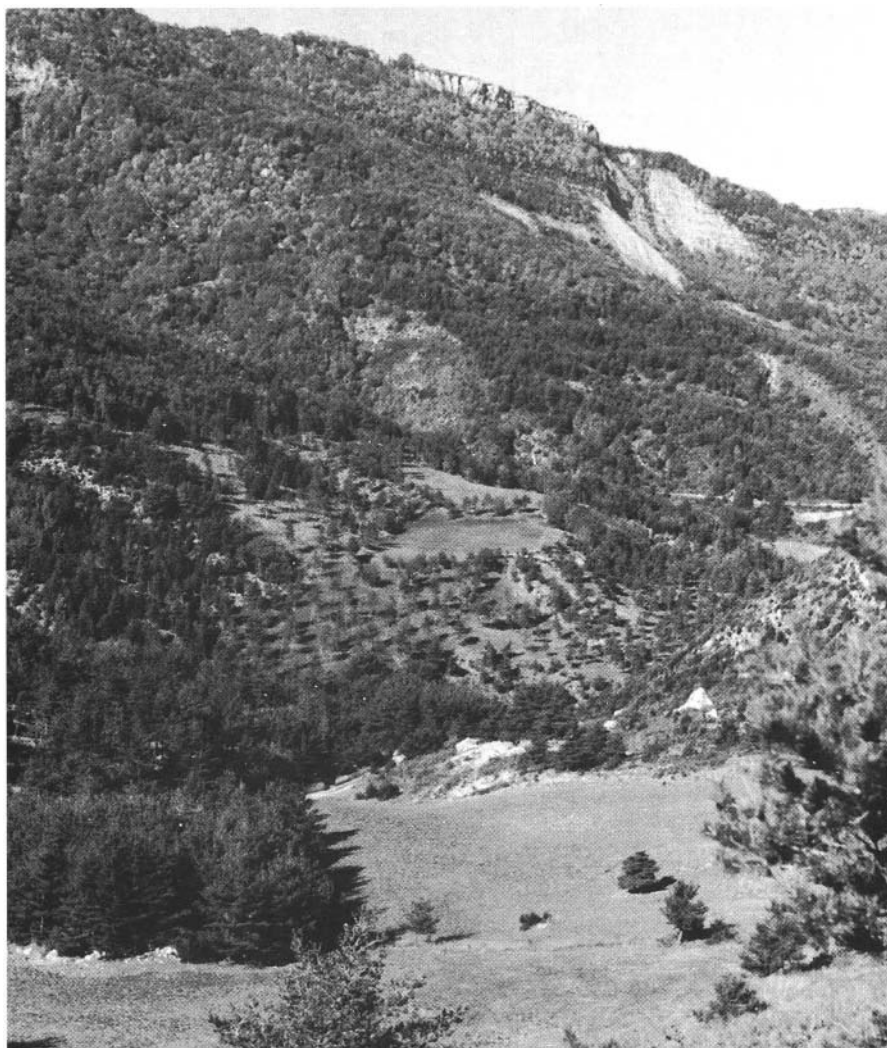
Photo 22 : Les moindres replats encore accessibles sont cultivés en prés de fauche enchassés dans la pinède de pin sylvestre - Laborel (Drôme) 1000 - 1300 m d'altitude.