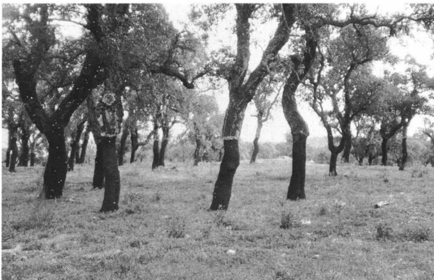
Photo 19 : Suberaie dans les Pyrénées Orientales.

Le principe est d'associer sur un même espace un couvert forestier lâche, recommandé pour la production du liège, et un pâturage de qualité. Il a été montré que ce type d'association était à bénéfices réciproques avec une augmentation de la productivité globale du milieu notamment dans les paysages de "Dehesa" de la péninsule ibérique et dans certaines expériences d'"agroforestry".