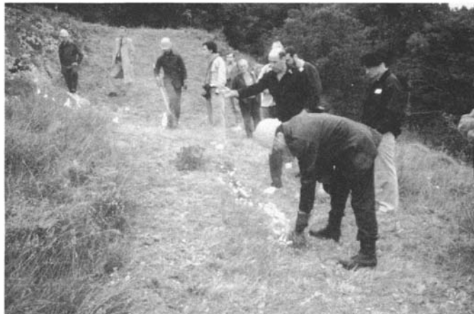
« Éclairage » contrôlé du milieu du layon pour créer un cordon sanitaire, coupe-feu parfait avant de laisser partir, sur la gauche, ce qui deviendra un contre-feu.