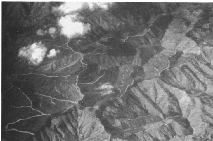
Massif andalous équipés en pare-feu.