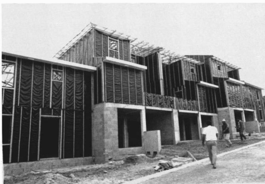
Un lot de gros œuvre terminé à Istres (voir ci-contre). On voit bien les éléments d'isolation thermique insérés dans la structure bois.