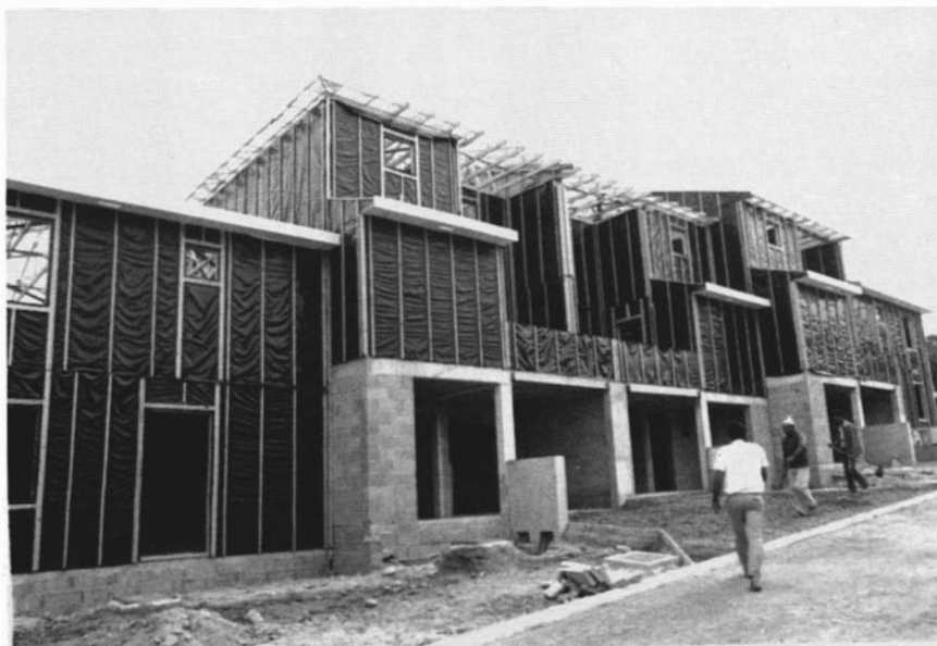
Un lot de gros œuvre terminé à Istres (voir ci-contre). On voit bien les éléments d'isolation thermique insérés dans la structure bois.