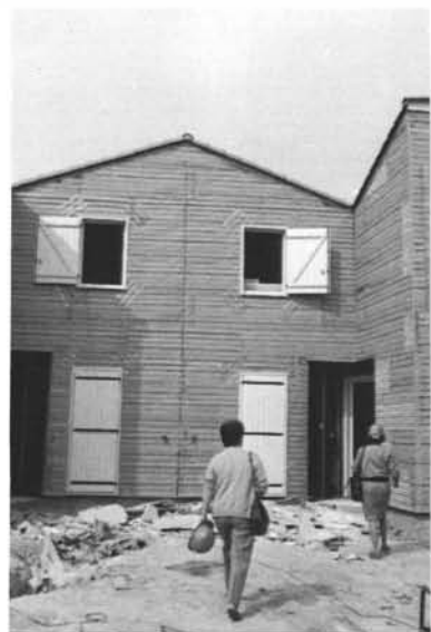
Les façades recouvertes du treillis métallique.