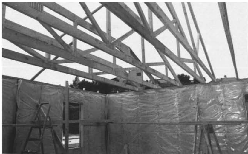
Pose des fermettes et de l'isolation + pare-vapeur intérieur sur l'ossature.