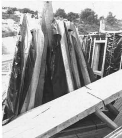
Réception d'une maison « en kit » : panneaux avec pare-vapeur, fermettes.

Les trois équipes Houot de 2 personnes affectées au chantier d'Istres montent à l'aide d'une seule grue l'ossature de 4 maisons par semaine sur les plateformes horizontales en dur réalisées au préalable. A ce propos, les pentes importantes du terrain impliquent des travaux lourds de terrassement pour réaliser ces plateformes, devant de surcroît ménager les 25 cm réglementaires entre le sol et le bois.