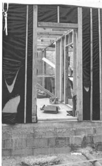
La dalle de maçonnerie supportant l'ossature bois.