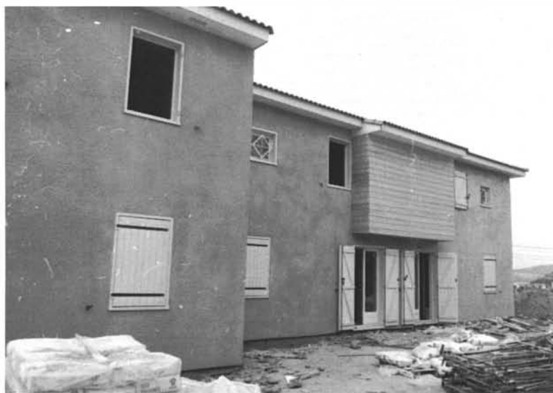
Des façades terminées : large part à l'enduit et peu au bois.