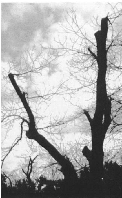
Châtaignier un an après la taille de régénération.

seule intervention est « l'éclaircie traditionnelle » menée vers l'âge de dix ans. Sur chaque brin, choisi à raison de un brin par cépée, on a prélevé deux carottes diamétrales et perpendiculaires, en prenant comme azimuth de base la ligne de plus forte pente du brin. On a de plus récupéré les billons où ont été faits les prélèvements. Les mesures des traits et les profils microdensimétriques ont été réalisés sur les carottes. Des rondelles et des échantillons complémentaires issus du billon ont servi pour l'étude anatomique.