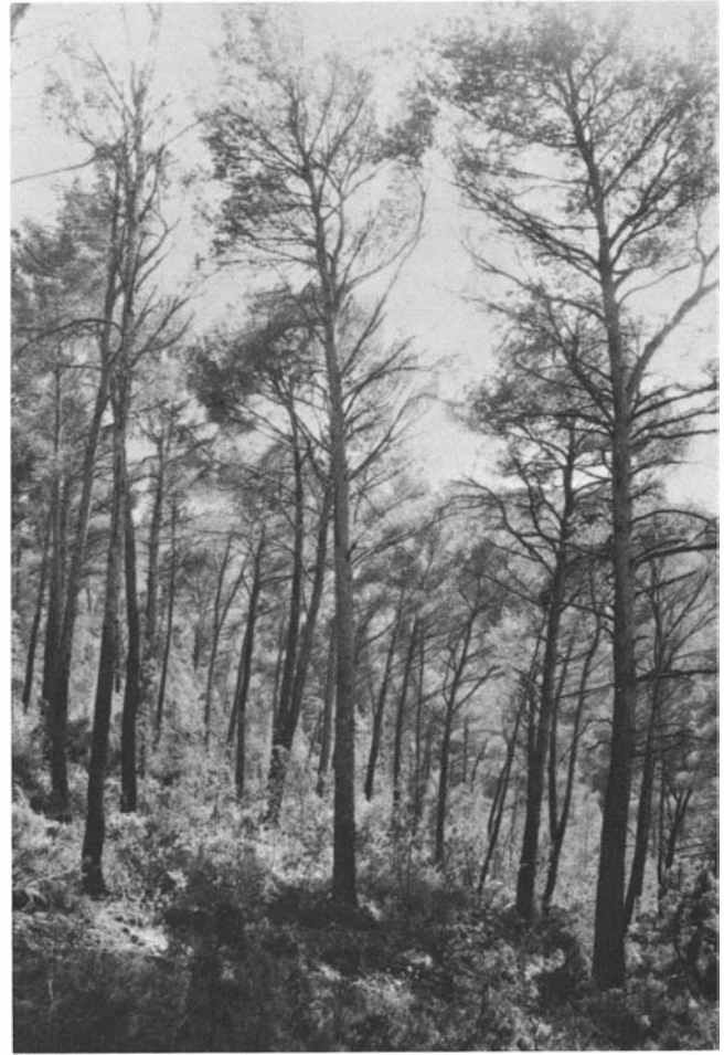
Photo 6. Futaie adulte après l'exploitation d'une coupe d'éclaircie (Forêt privée à Meyreuil).