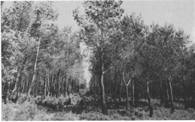
Photo 4. Eclaircie dans un perchis avec présence d'un cloisonnement tous les 15 m.