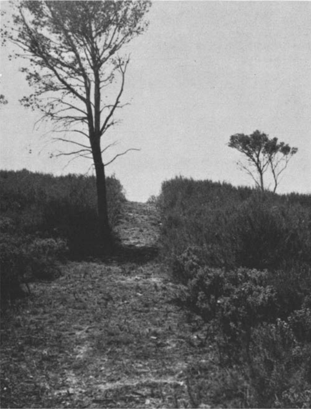
Photo 1. Cloisonnement obtenu par gyrobroyage dans un peuplement au stade fourré. (Forêt domaniale de Castillon).

Il faut donc recourir à des méthodes simples faisant appel, chaque fois que c'est possible, à la mécanisation. Si la surface le justifie, il faut, dès ce stade, faire des cloisonnements. On peut encore les faire par gyrobroyage sur des largeurs de 3 mètres. De part et d'autre de ces cloisonnements distants d'une dizaine de mètres, on effectue les dépressages au croissant. Si le dépressage en plein est trop coûteux, on peut tenter de ne le faire que partiellement sur 2 mètres de façon à permettre l'émergence rapide dans ces bandes des arbres d'avenir. Cette opération, même partielle, présente l'avantage de rendre le peuplement plus pénétrable, dès le début, et de favoriser la croissance d'arbres de place répartis de façon régulière