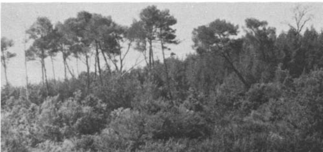
Photo 7. Gros semenciers surplombant une régénération naturelle; on remarque la présence d'arbres secs (Forêt privée à Rousset).

Il faut tendre à régulariser ces peuplements en évoluant vers une futaie par parquets dont les surfaces seront les plus étendues possibles (optimum 3 à 4 hectares). Cela se traduira par la succession de deux opérations :