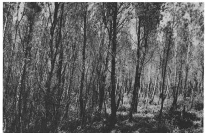
Photo 3. Eclaircie dans un perchis à droite; à gauche zone témoin (Forêt communale de Cyreste).

Le programme FEOGA a permis de réaliser de tels travaux par des entreprises. Dans ce cas, il faut bien veiller à ce que celles-ci fassent non seulement l'éclaircie par le bas (enlèvement des secs, dominés et fourchus), mais aussi une éclaircie par le haut (enlèvement des co-dominants). Il est souhaitable que dans le prochain programme FEOGA un maximum de peuplements de pin d'Alep soient ainsi traités.