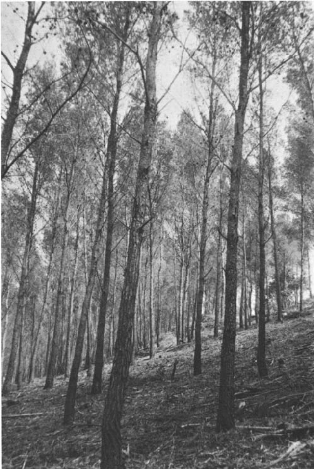
Photo 5. Coupe d'éclaircie dans une jeune futaie (Forêt privée à Saint Cyr-sur-Mer).

Lorsque les diamètres moyens sont supérieurs à 25 cm, il faut prévoir à nouveau une coupe d'éclaircie par le haut associée à une coupe sanitaire. On fixera le diamètre d'exploitation à 40 cm pour les zones de fertilité moyenne à bonne (cela correspond à un âge voisin de 80 ans)