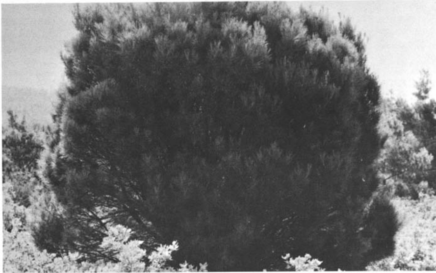
Photo 2. Form of P. brutia growing naturally in the island of Lesbos. Forme de P. brutia dans l'île de Lesbos.