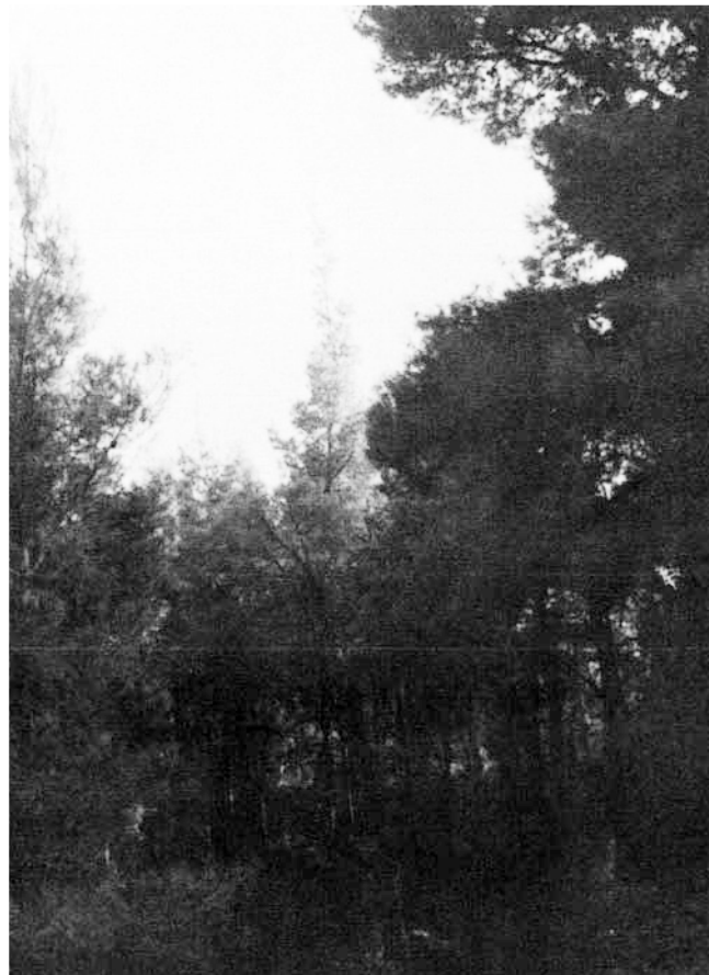
Photo 4. Narrow crowned P. halepensis tree. Pin d'Alep à cime étroite.

Sur l'île de Lesbos la rencontre fréquente d'arbres avec des « balais de sorcières » est remarquable. Des graines récoltées sur l'un d'entre eux produisirent des plants qui furent normaux et des nains comparables à ceux obtenus d'un « balai » poussant sur un pin d'Alep. (Panestos 1981).