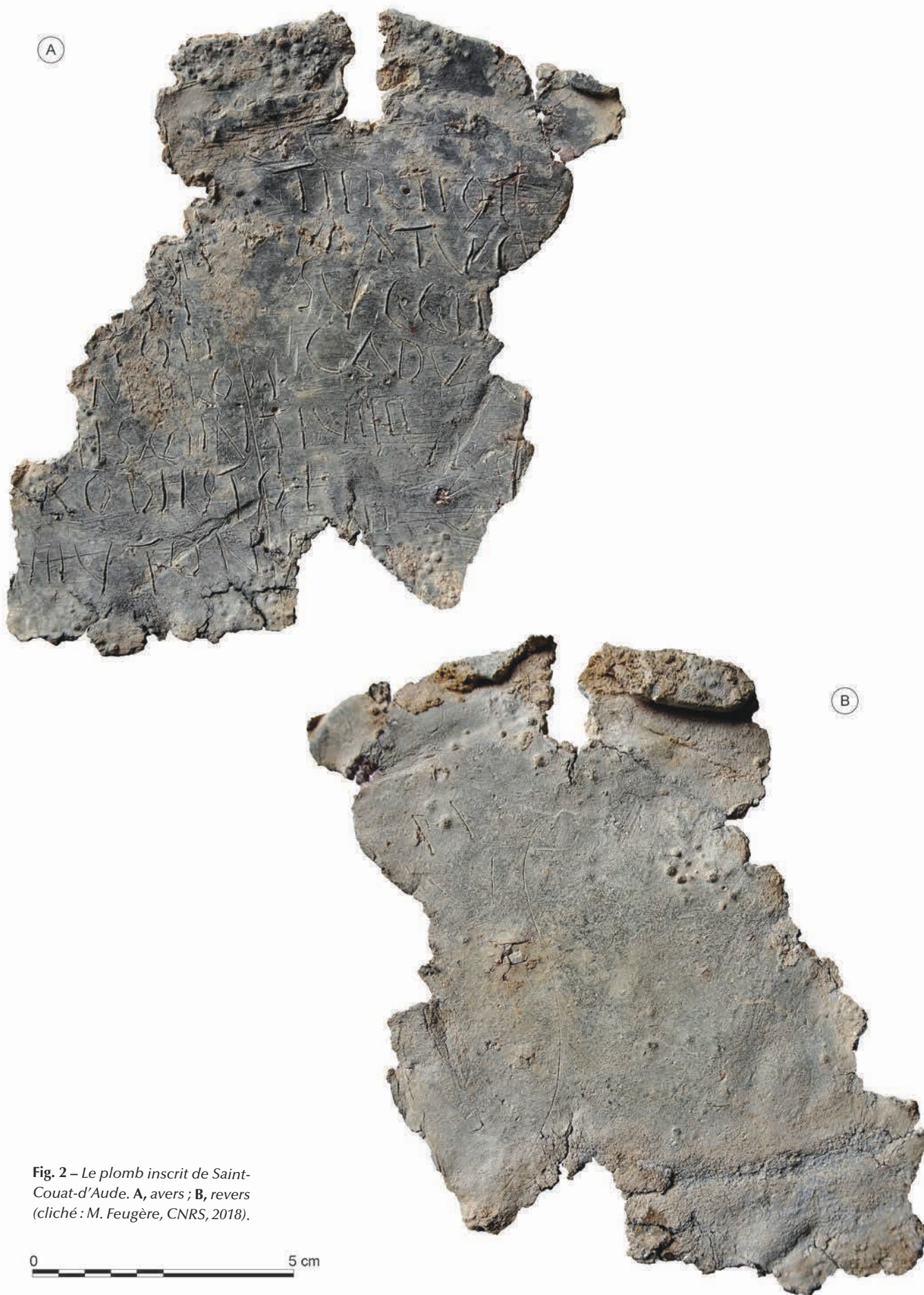
Fig. 2 – Le plomb inscrit de Saint-Couat-d'Aude. A, avers ; B, revers.