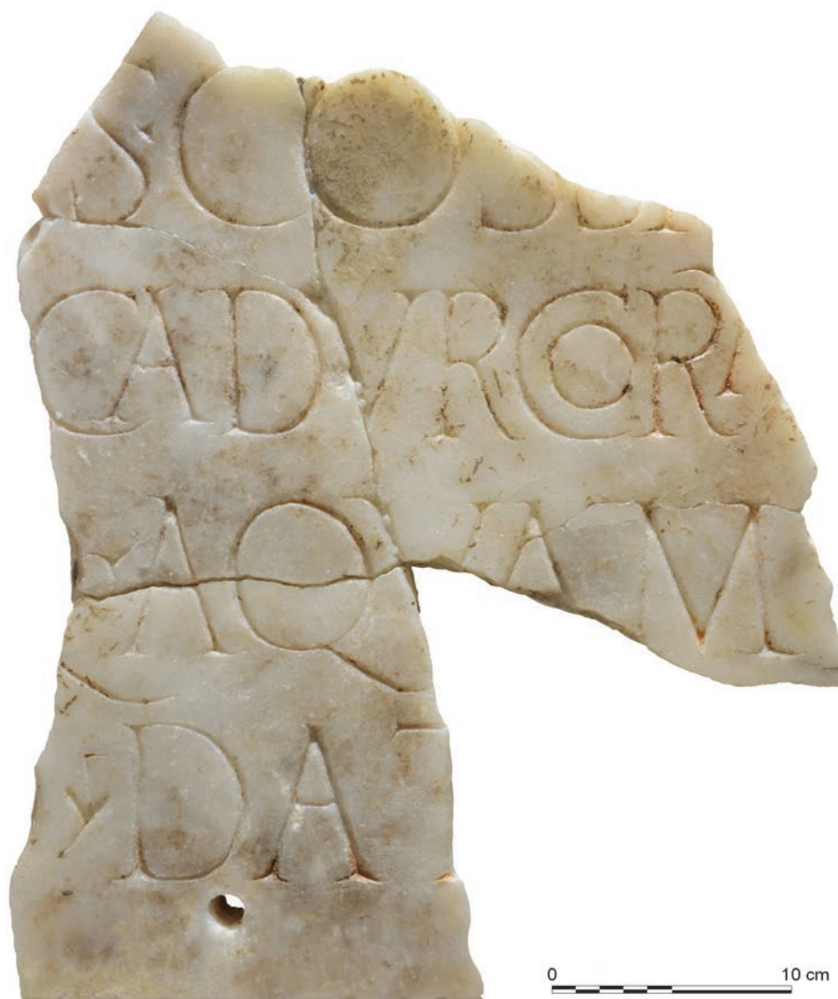
Fig. 2 – L'inscription de Cosa.

dans l'échancrure du M est vraisemblablement identifiable : l'ornement supérieur s'apparente au sommet gauche du V d' aquam ou du premier V de Cadurcorum – qu'une fracture empêche cependant de bien visualiser – avec un développement plus prononcé. On note le recours à des signes de ponctuation variables en fonction des lignes : une séparation triangulaire de 0,50 cm de côté à la première ligne, une interponction à trois branches à la troisième et une hedera stylisée, haute de 2,30 cm, à la dernière (Pisani 2008a, p. 56). Dans l'épigraphie de la cité voisine des Pétrucos (ILA, Pétrucos , 23), on a fait remarquer que l'inclusion CO était en usage dès le 1 er s. apr. J.-C., ce qui constitue un jalon chronologique de première importance pour l'inscription qui nous intéresse. Le texte, jusqu'ici daté vaguement du 1 er ou du 2 e s. apr. J.-C., pourrait être ainsi rattaché aux premières décennies de notre ère (Dondin-Payre, Raepsaet-Charlier 1999, p. IX) 8 .