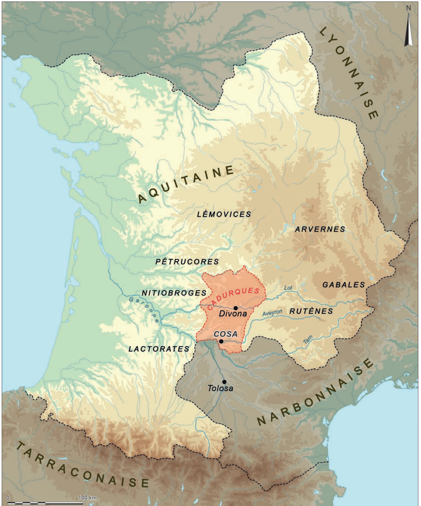
Fig. 1 – La cité des Cadurques dans son contexte provincial (DAO : F. Delrieux, université Savoie Mont Blanc).

systématiquement mise à profit : le A est légèrement engagé dans celle du C initial et le O, de taille nettement inférieure à celui de la première ligne et du cercle du Q à la ligne suivante, a été gravé à l'intérieur de l'arrondi du C. À la fin de la ligne,