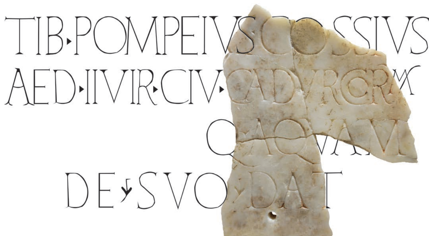
Fig. 5 – Hypothèse de restitution de l'inscription de Cosa donnée à titre indicatif (DAO : M. Monteil, université de Nantes).