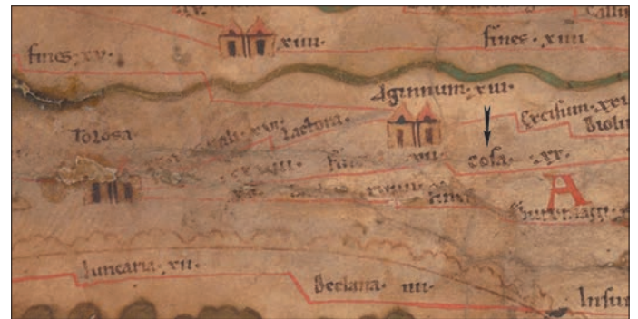
Fig. 4 – Extrait de la Table de Peutinger : itinéraire de Tolosa à Cosa.

L'ancienneté de l'occupation humaine dans la zone, reconnue depuis longtemps, a fait l'objet de diverses notations depuis le XVII e s., signalées dans un bilan récent (Pisani 2008b, p. 18-21) : la première identification du toponyme Cosa , mentionné sur la Table de Peutinger , avec le lieu-dit Cos, reviendrait à Marc-Antoine Dominicy (1634). Au XX e s., l'Histoire de la Gaule de Camille Jullian qualifie Cosa de « vicus le plus important des Cadurques » (1920, p. 393). C'est d'abord dans les années 1930, puis surtout dans les années 1950 et 1960 qu'eurent lieu des fouilles archéologiques sous la direction du Pr Michel Labrousse, dont les résultats sont publiés sous forme de comptes rendus réguliers dans le Bulletin de la Société archéologique du