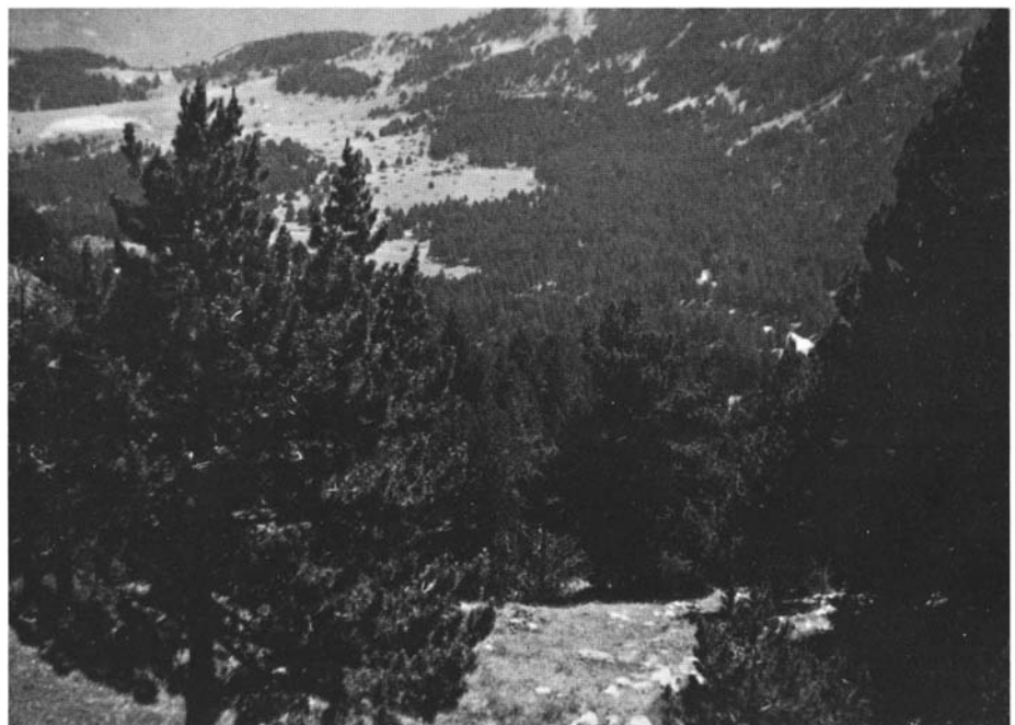
Photo 1. – Pins à crochets ( Pinus uncinata ), vers 1 800 m à Super Molina, Catalogne.

Plusieurs essences y font leur apparition : à la base de l'étage le Sapin, les Bouleaux ( Betula pubescens et B. pendula ) et surtout le Pin à crochets ( Pinus uncinata ) qui seul monte beaucoup plus haut (2 300-2 400 m). Du point de vue économique, mis à part le Sapin, ces essences ne sont guère intéressantes mais leur rôle protecteur contre toute forme d'érosion et dans la conservation des biocoenoses subalpines est fondamentale.