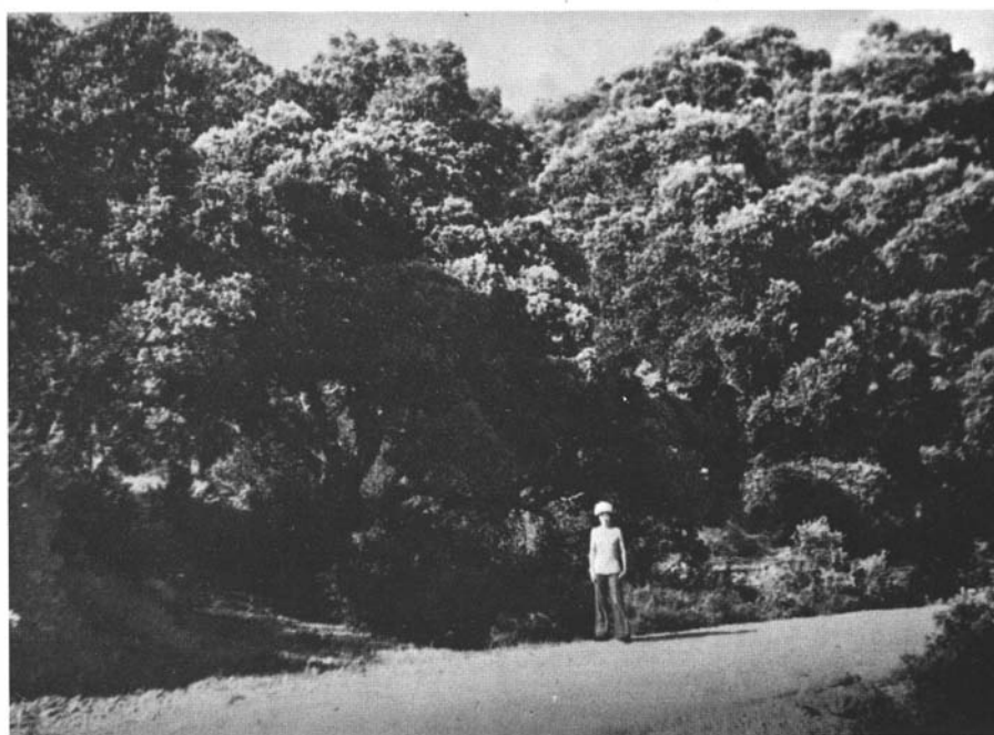
Photo 3. - Chêne vert ( Quercus ilex ssp. rotundifolia ) vers 1 200 m, au Turbon, Aragon.

Le rôle du Chêne pubescent, en moyenne montagne de ce versant des Pyrénées, n'est pas à mettre en doute car on connaît des vallées (Capdella-Rio Flamisell par exemple) où les Conifères sont presque totalement absents de cet étage.