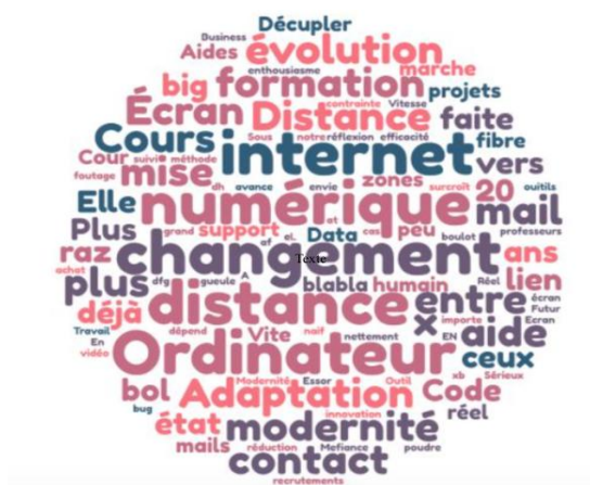
Nuage de mots les plus cités

Les résultats révèlent dans un nuage de mots, assez intéressant permettant de mettre en avant que le passage au numérique a d'abord été perçu comme un changement. Ce changement dans la formation et l'apprentissage se voit comme une évolution, un élément de modernité, mais également une nécessaire adaptation. Le changement n'est donc pas été évident et allant de soi, il a nécessité pour les enseignants comme pour les élèves une adaptation progressive et parfois nécessitant une prise de risque. En effet, pour certains le numérique a favorisé la mise en contact et la création de lien ; pour d'autres cette soi-disant révolution a déshumanisé la relation pédagogique. Selon l'analyse des mots, les injonctions se sont essentiellement faites au niveau de la communication, de la formation, de l'outil numérique et du changement de pratique. Les tensions ont été ressenties par les individus sur la notion de distance, de nouveauté, de temporalité et de mise à distance.