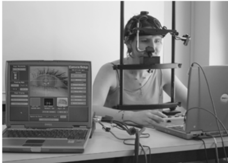
Figure 2. Système EYELINK® II (SR Research Ltd 2004, Ontario, Canada).

Les systèmes enregistrent une quantité considérable de données. On ne retient généralement que les pauses de l'œil (fixations) qui témoignent des traitements cognitifs et les sauts d'une fixation à l'autre (saccades) davantage sous le contrôle de la perception et des mécanismes oculomoteurs. Les fixations et les saccades représentent les éléments fondamentaux de l'étude oculométrique à partir desquels sont calculées plusieurs mesures spatiales et temporelles du déplacement du regard: les mesures spatiales concernent la taille des saccades et la localisation des fixations, les mesures temporelles concernent les durées des fixations.