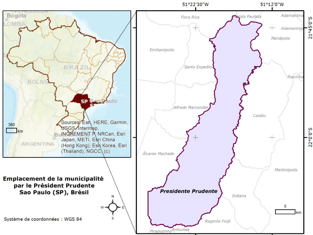
Figure 1- Localisation de la municipalité de Presidente Prudente-SP- Brésil

Selon les données de terrain, en environ 10 ans (2008-2019) de « Mutirão do Lixo Eletrônico », plus de 785 tonnes de DEEE ont été collectés dans la commune et les principaux déchets collectés étaient de catégories 2 et 6 (Bortoli et al., 2018), à savoir: