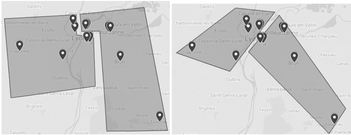
Figure 4.: Carte des deux séparations en 2 clusters d'employés