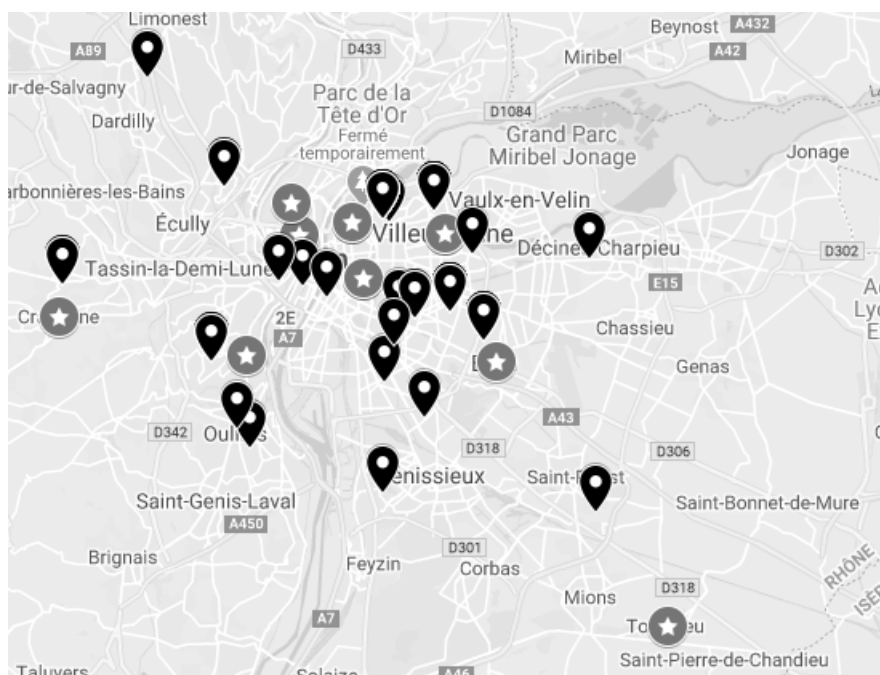
Figure 1.: Aperçu zoomé de la localisation des patients (repères noirs) et des orthophonistes (étoiles grises)

Sur la Figure 1, on peut voir la localisation des professionnels et des patients, et se rendre compte de l'éloignement des points à visiter et des points de départ des professionnels. Dans cet exemple, nous avons 12 orthophonistes (représentés par des étoiles grises) et 100 patients à visiter (représentés par des repères noirs, dont plusieurs se superposent lorsque les adresses sont proches ou que les patients fréquentent la même école).