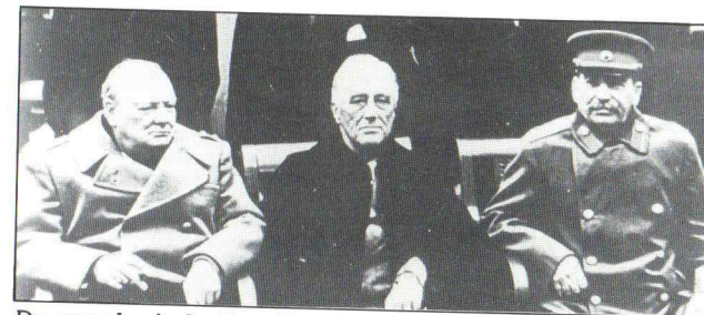
De gauche à droite : Churchill, Roosevelt, Staline.

Le film de Vajda est assez bien fait pour rester neutre, impartial, comme doit l'être un constat. L'auteur a monté des documents d'archives en alternance avec les témoignages ds proches qui ont survécu à ceux qui ne sont plus. Le film tire d'ailleurs toute son ampleur de cette impartialité. Car on nous donne là de quoi cogiter. Au point d'ailleurs que lorsque l'artiste a voulu avoir quelques témoignages sur la « longue maladie » qui a emporté en 1974 Georges Pompidou dont le physique s'était dégradé au fil des mois, il n'a trouvé personne pour lui répondre.