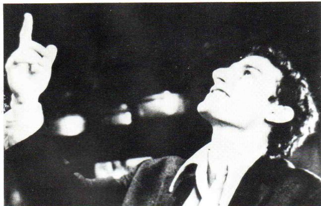
Nicos PAPATAKIS, 1966.

Ce garçon réussit à fuir son pays et arrive ici avec une photo qui est son lien avec la Grèce puisqu'il aime cette chanteuse représentée sur la photo. Par le prétexte de cette photo, il entre dans une nouvelle aliénation, peut-être pire que celle qu'il subissait en Grèce parce qu'il est partie prenante de cette aliénation dont il ne peut pas s'échapper. Pour la première fois de sa vie quelqu'un se comporte amicalement avec lui. Son amitié augmente au fur et à mesure qu'il est obligé de perpétuer ce mensonge envers cet ami et il est pris dans un dilemme, ce qui en fait un personnage tragique. Au moment où il rentre dans son pays, il y a la chute des colonels mais il ne peut plus sortir de sa propre aliénation.