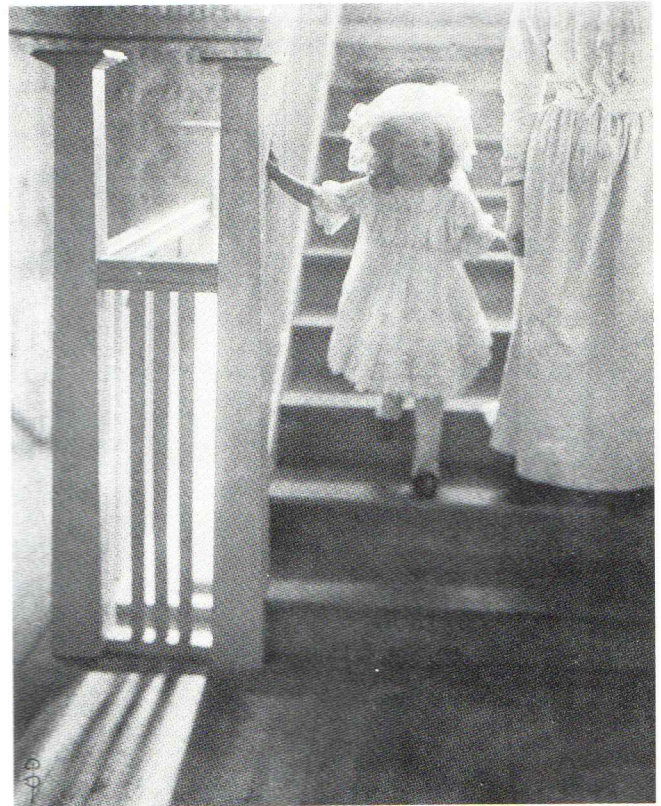
Départ pour la promenade, 1907. (Epreuve platine).

ses propres limites esthétiques. Cette rétrospective Dubreuil nous apporte une réponse possible et surtout la certitude qu'il reste encore beaucoup à dire et à montrer de ces précurseurs que l'histoire a trop hâtivement chassés de ses annales.