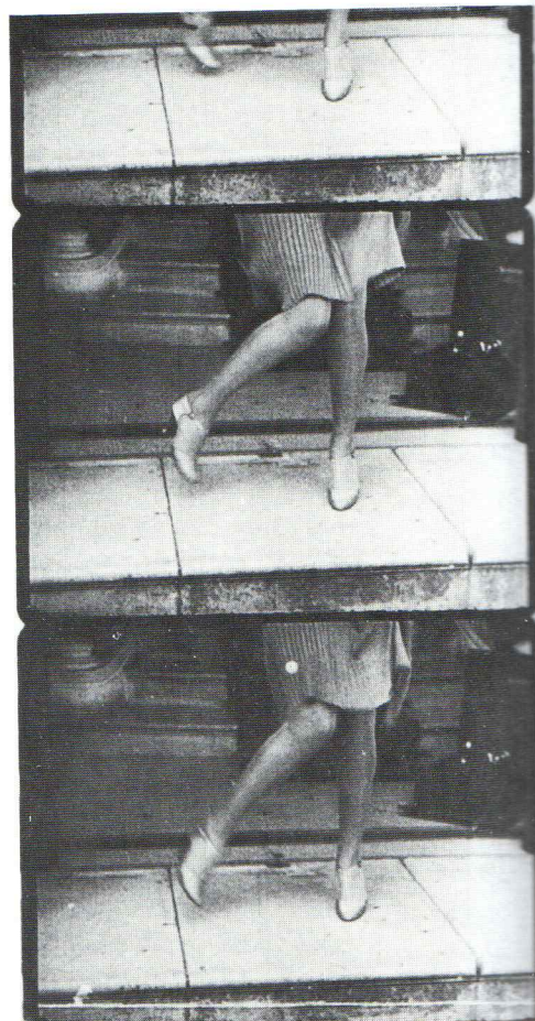
Man Ray Photogrammes du film Emak Bakia 1926