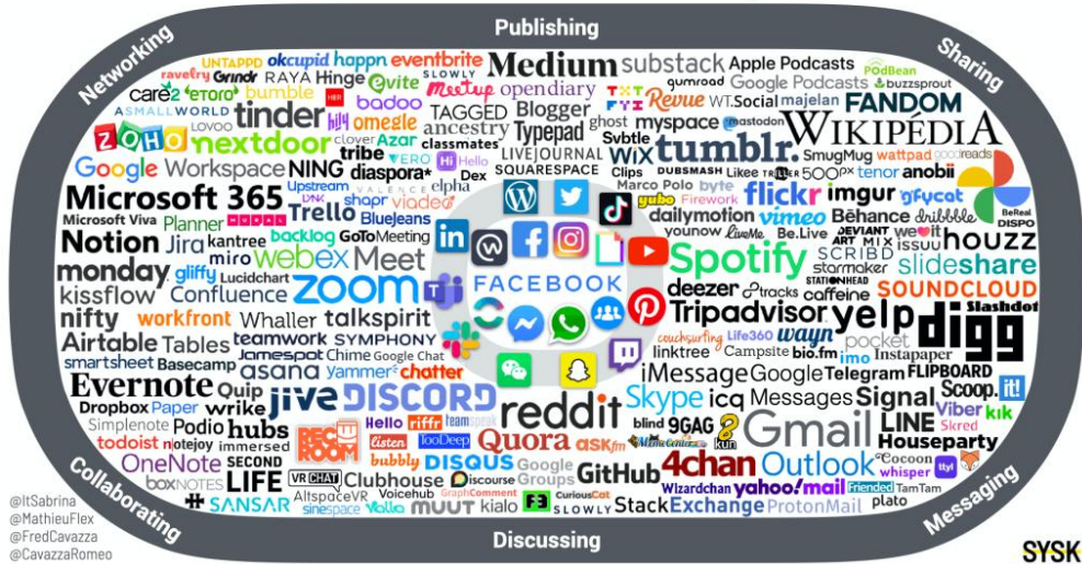
Figure 3 : Le paysage 2021 des médias sociaux d'après Cavazza

Le cadre étant posé, il convient de soulever notre problématique et les questions de recherche qu'elle induit.