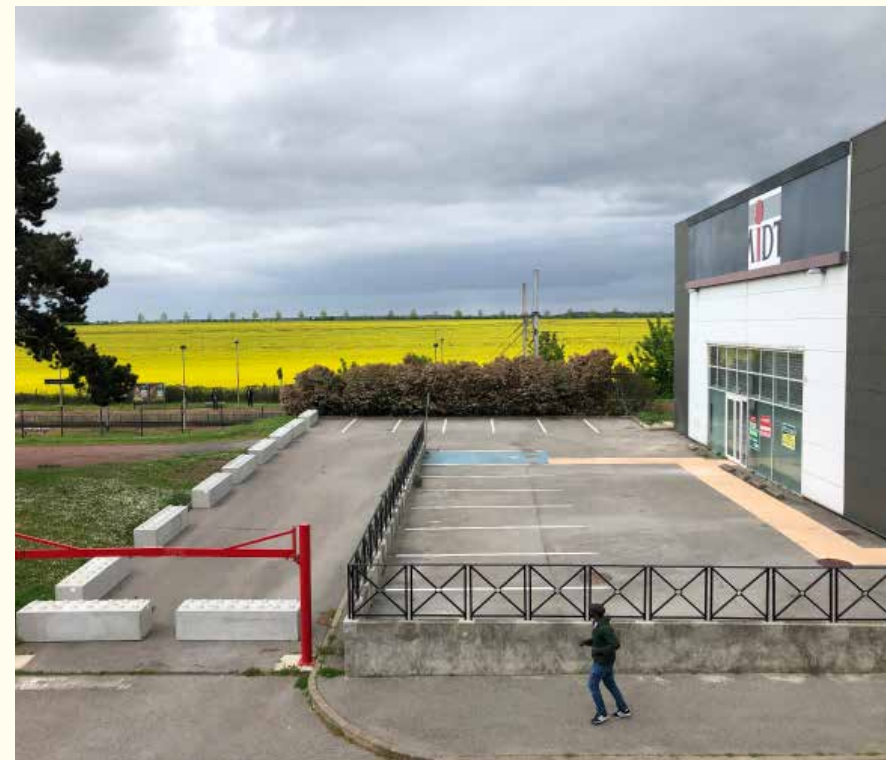
Des boîtes et des champs, Plaisir, face à la plaine de Versailles, mai 2021

un travail de variation d'ambiances (couleurs, acoustique, etc.). Enfin, concernant l'apport du végétal vu tant comme nécessaire que comme délétère lorsqu'il n'est pas entretenu, le travail de conception s'est porté sur un assemblage entre évocation et végétal vivant. Ainsi, les notions de confiance, de capacité d'écoute, du « savoir dialoguer », convoquées par Ariella Masbounji dans l'ouvrage sous sa direction Fabriquer la ville : outils et méthodes 16 , semblent essentielles à la recomposition des missions de suivi de maîtrise d'œuvre. L'urbaniste les synthétise d'ailleurs dans la formule : « une maîtrise d'œuvre jouant un rôle de compagnon de route ». Avec le recueil de ces besoins et attentes, nous nous sommes rappelée les propos de Patrick Bouchain, pour lequel il s'agit de tendre à « définir un faisceau