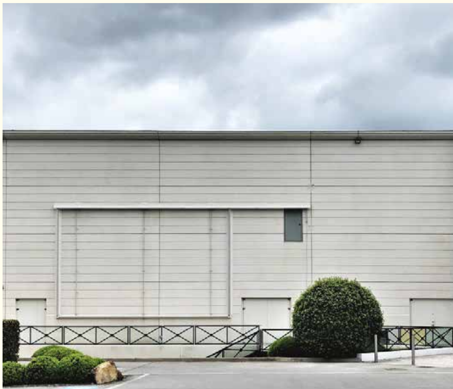
Opacité ou le pendant d'une façade intériorisée, Alphapark, Les Clayes-sous-Bois, Yvelines, mai 2021

ces dispositifs demandent des compétences organisationnelles et relationnelles. Le fait que cette mission n'ait pas été externalisée 15 a permis une plus grande cohérence, une rapidité de réponse et une cohésion entre les suggestions proposées et les intégrations au projet. Quelques exemples de transcriptions formelles à partir des ateliers réalisés. Les sas d'entrées jugés sordides et donnant un fort sentiment d'insécurité ont fait l'objet d'une attention particulière de la part des architectes pour renforcer l'apport de lumière naturelle, grâce notamment à des puits de lumière. Pour répondre au manque de lisibilité du centre – les usagers se repérant souvent plus à la localisation des enseignes qu'aux entrées ou types de mails –, le choix des concepteurs s'est porté sur la création de repères visuels identifiables et sur