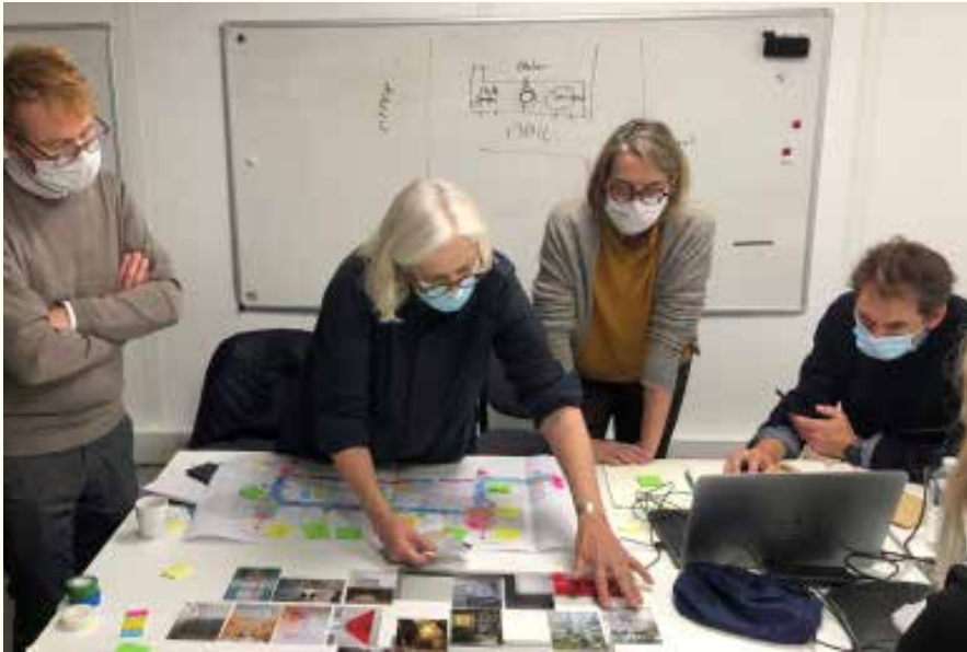
Atelier de concertation, décembre 2020 © Arte Charpentier Architectes

— Première page : Zone commerciale au nord d'Annecy, Épagny, Haute-Savoie, octobre 2021