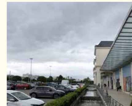
Centre commercial typique du modèle paquebot-île, Alphapark, Les Clayes-sous-Bois, Yvelines, mai 2021

De ces échanges, les attentes des différents acteurs sont ressorties de manière particulièrement lisible. Les commerçants formulaient le besoin de trouver les moyens de générer du flux tandis que leurs salariés abordaient le cadre de travail et exprimaient le souhait d'avoir des espaces extérieurs de qualité, notamment pour les temps de pause comme les repas. Les habitants, quant à eux, évoquaient l'accessibilité. Pour eux, le centre se doit d'être une sorte d'anti-labyrinthe où l'on accède très rapidement aux espaces souhaités. Les associations exprimaient quant à elles le