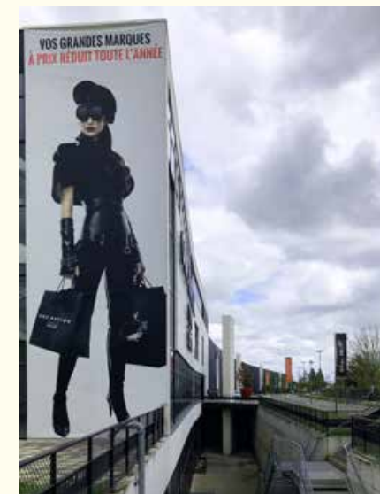
Monofonctionnalité et fracture avec la ville, One Nation, Les Clayes-sous-Bois, Yvelines, mai 2021

besoin pour les personnes à mobilité réduite d'anticiper leur venue en la préparant en amont sur internet. Ici, la lisibilité numérique et les repères sur place, comme la taille des lettres de signalétique, apparaissent primordiaux. Comme l'évoquent le chercheur Jean-Jacques Terrin et l'architecte et urbaniste Burcu Özdirlik dans leur ouvrage La Conception en question, la place des usagers dans les processus de projet 14 ,