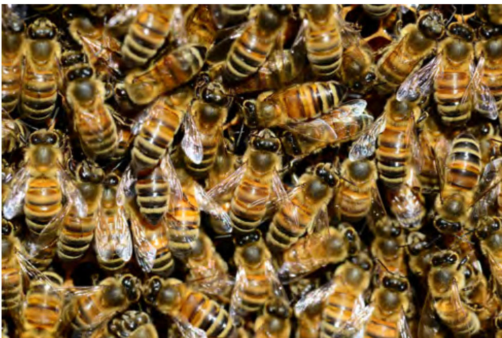
Abelles, imatge d'un rusc (2014).

Poc o molt d'aquests dos punts trobem en el pensament contemporani progressista, en el