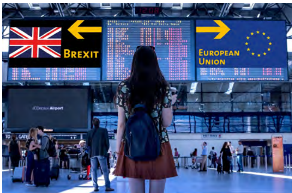
Brexit (2019). PIXABAY.COM