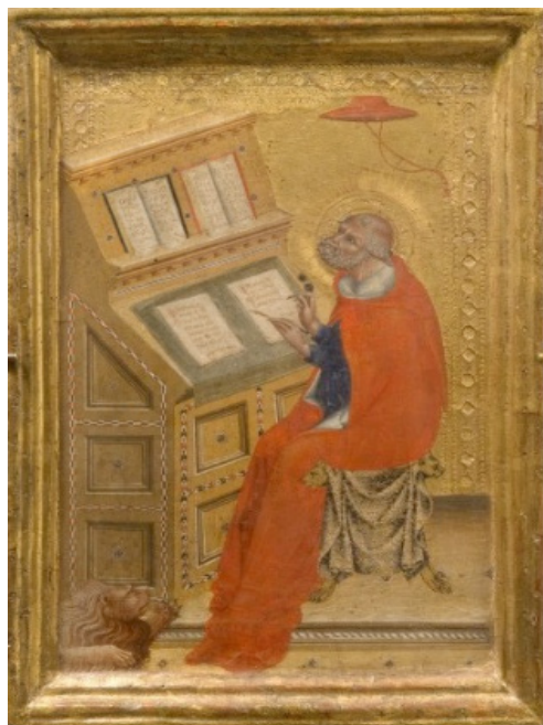
Saint Jérôme dans son cabinet d'étude, Giovanni di Paolo (entre 1425 et 1430)

d'entreprise. L'idée est de mettre en lumière, en fournissant données, instruments de mesure et outils analytiques, la convergence ou la non-convergence des systèmes de gouvernance d'entreprises nationaux grâce à l'analyse des small worlds intervenant à l'échelle internationale et de montrer dans quelle mesure la globalisation a affecté ces petits mondes.