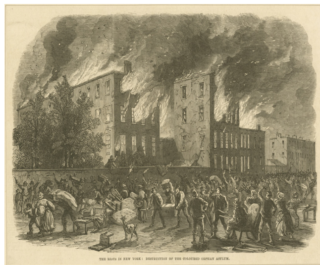
Figure 5: Un orphelinat attaqué, Brooklyn, The Illustrated News (1863)