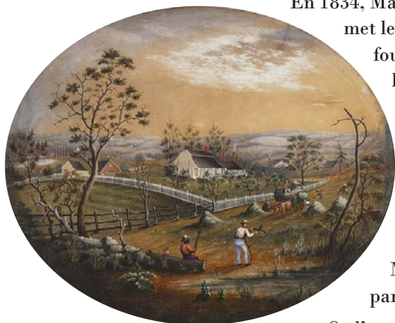
Figure 4 Johnson Residence and Remsen House, James Ryder Van Brunt (1867) Brooklyn History Society.

En 1834, Manhattan est victime d'une terrible attaque. La population blanche met le feu à tout ce qui rappelle le mouvement abolitionniste. La mob , ou foule en colère, se met ensuite à attaquer les New Yorkais noirs dans la rue et à les torturer. Brooklyn à l'inverse reste un endroit calme, avec beaucoup de terres disponibles et d'espace, comme l'illustre la figure 4.