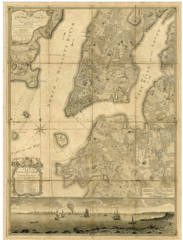
Figure 1 Plan Ratzer de New York, 1776

La partie sud de la péninsule montre des signes de planification urbaine assez intensive, avec des fermes et des artères, tandis que Brooklyn – de l'autre côté de l'East River – reste beaucoup plus rurale, avec des espaces ouverts. Cette distinction va dicter la manière dont l'esclavage et ensuite l'activisme antiesclavagiste vont se dérouler.