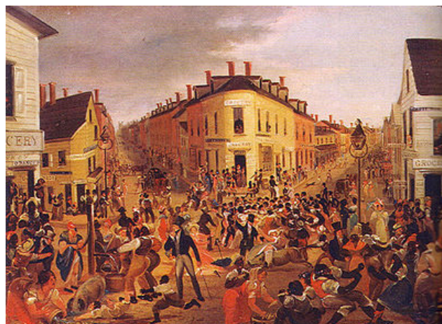
Figure 3 Five Points intersection, George Catlin (1827)

L'activisme noir retrouve un second souffle avec la montée du mouvement (blanc et noir) abolitionniste, et la création de l'American Society of Anti-Slavery à Philadelphie en 1833. À partir de cette date, abolitionnistes noirs et blancs travaillent de concert. Pour la première fois de l'histoire des États-Unis, des descendants d'Européens et d'Africains se rejoignent dans un débat politique. Ce mouvement devient rapidement un des plus détestés car le reste de la population craint qu'il ne soit la cause d'une guerre civile et refuse dès lors que les blancs et les noirs aient le droit de se rassembler dans les églises ou sur la place publique.