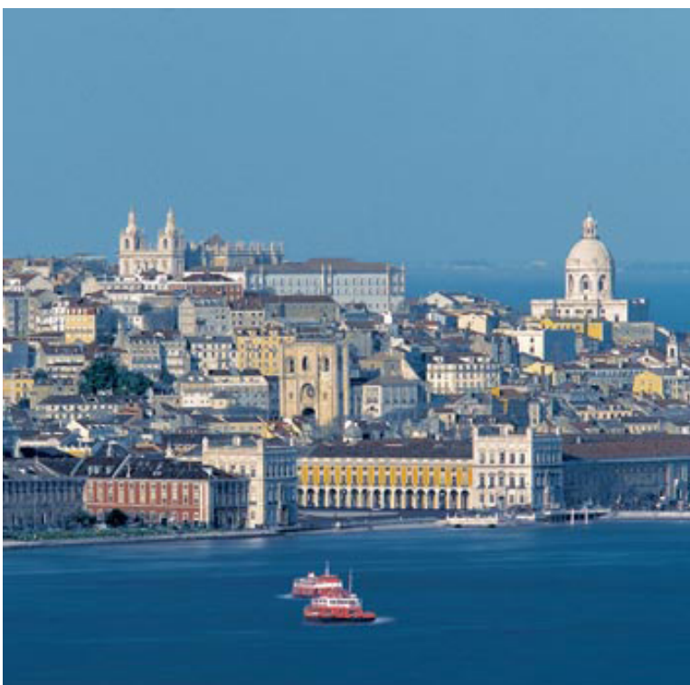
Lisbonne depuis le Tage