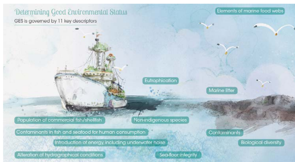
Figure 1 : Les critères du « good environmental status » définis par la Marine Strategy Framework Directive (Potocnik, 2014, p. 81)