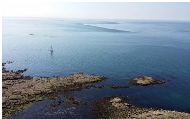
Vue du Phare de Gatteville 17 mai 2014 (MB)

niveaux insoupçonnés. Du chalutage de fond qui ramasse de façon indifférenciée coraux et faune aquatique, laissant derrière lui une nécropole marine, à la surpêche du thon, en passant par la pratique du shark finning , la pêche à l'échelle mondiale comme locale apparaît comme un ensemble de pratiques absurdes et irresponsables dont le seul horizon semble être l'anéantissement des écosystèmes marins, avec toutes les conséquences que cela implique en termes de changement climatique et de bouleversements. Jusqu'ici la sanctuarisation de l'espace maritime a été la principale voie d'action à travers l'établissement d'Aires Marines Protégées, dont l'approche cependant doit être repensée. Un management dynamique de la pêche est nécessaire, passant par la gestion d'un réseau interconnecté d'Aires Marines Protégées, le management des communautés locales de pêcheurs, la régulation internationale des pratiques de pêche, et la coordination de la gouvernance marine impliquant toutes les parties prenantes. En outre, la planification spatiale marine pourrait être une solution à long terme, intégrant tous ces multiples aspects et impliquant non seulement les pouvoirs publics mais aussi les différentes parties prenantes. Enfin, l'éducation publique est inséparable d'un management durable des ressources marines car ce sont bien les comportements des consommateurs finaux qui encouragent et favorisent les pratiques de pêches destructrices ■