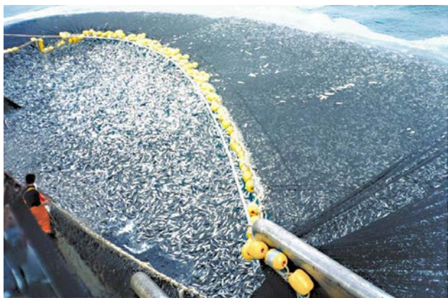
Figure 1 : Environ 400 tonnes de maquereaux pêchés au large du Pérou

croissant, l'expansion de la pêche et des canaux de distribution plus efficaces. Or, le poisson est la seconde source de protéines la plus consommée, juste derrière le porc : en 2010, le poisson représentait 16,7% de la consommation mondiale en protéines animales. Avec des prévisions de populations atteignant les 8,3 milliards d'habitants en 2030, il faudra 50% en plus de production énergétique, 40% supplémentaires d'eau et 35% supplémentaires d'approvisionnement alimentaire d'après le rapport du National Intelligence Council (2012). La Chine et l'Asie du Sud-Est dominent la croissance mondiale et ont le plus fort impact sur les besoins en énergie et en produits alimentaires.