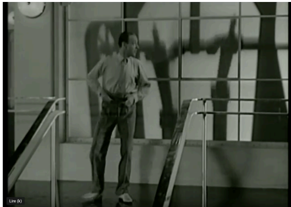
Ex. 6 Astaire imite les machines dans Slap that Bass 12

En effet, plusieurs performances de Fred Astaire participent clairement de la mutation bruiteuse et percussive du goût occidental depuis le début du XXe siècle, ex. 6 :