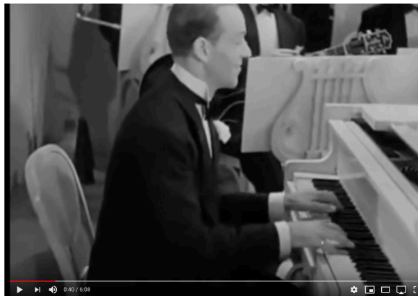
Ex. 7 Astaire au piano stride 14

Ce grand talent percussif d'Astaire se révèle encore lorsqu'on le regarde jouer du piano. Dans cet extrait de Roberta (1935), le danseur-étoile se montre aussi un redoutable pianiste de stride , genre difficile et virtuose, très rythmique et où les mains sautent beaucoup, ex. 7 :