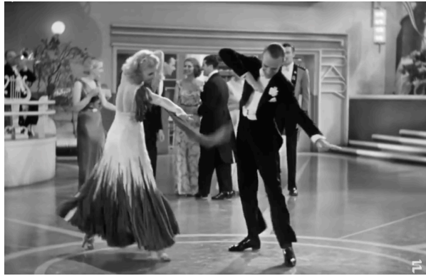
Ex. 3 Astaire et Rogers dansent le Continental 8

Le couple danse ici encore tout en fluidité vocale mais cette fois sur une musique sautillante qui fait contraste, rendant la situation plus riche 9 .