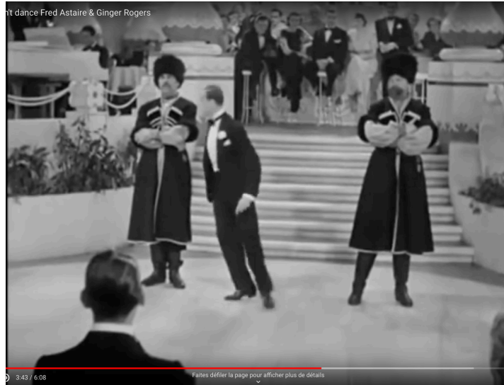
Ex. 8 Petit et grands, force des claquettes 15

Comment ne pas voir ici la force moderne que donnent les claquettes au « petit » Astaire pour faire face à la menace traditionnelle des « grands » cosaques ? Cela révèle un aspect subversif du rythme et des claquettes dans une culture occidentale jusque-là traditionnelle et vocale . Le modèle percussif implique souvent des tensions et des résistances face au modèle vocal alors en train de devenir complètement désuet.