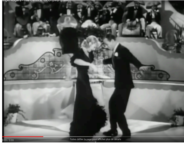
Ex. 5 Astaire et Rogers dansent la Carioca 10