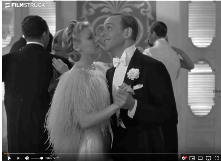
Ex. 2 Astaire et Rogers dansent Cheek to Cheek 4

La connotation paradisiaque des paroles correspond parfaitement à l'esprit de ce modèle, souvent tendant vers le surhumain. Ou encore, dans Stormy Weather et ailleurs, les Nicholas Brothers « volent » presque tout en dansant, et atteignent quasiment un surnaturel 5 d'ordre vocal 6 . De façon un peu plus sobre, Dancing in the Dark , célèbre duo d'Astaire avec Cyd Charisse 7 aurait aussi pu illustrer ce premier modèle, en renforçant le lien avec la tradition du ballet classique.