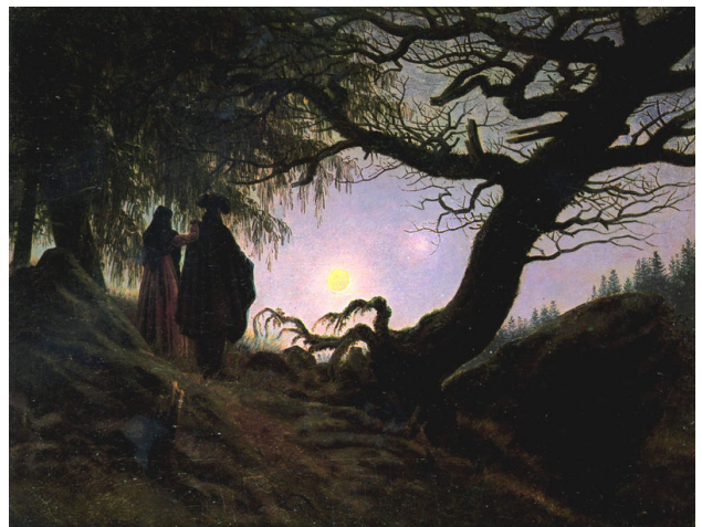
Couple regardant la lune, Caspar David Friedrich (1824)