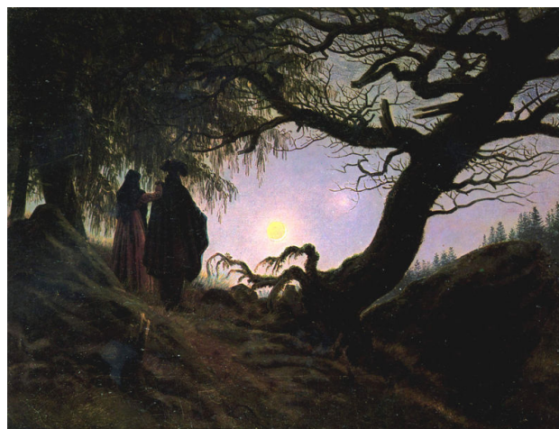
Couple regardant la lune, Caspar David Friedrich (1824)