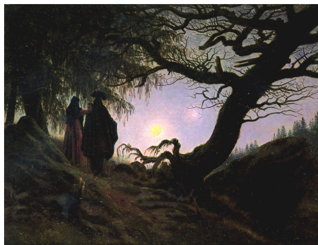
Couple regardant la lune, Caspar David Friedrich (1824)