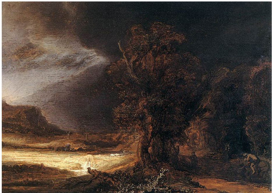
Paysage avec le bon samaritain, Rembrandt (1638)