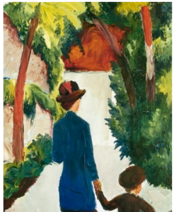
Mère et enfant au Parc, August Macke (1914)

Un nouvel instrument financier est apparu comme solution de secours lors des crises : les obligations sur catastrophes naturelles ou Cat bonds . Ce sont des obligations classiques assorties d'une clause de non-remboursement partiel ou total en cas de survenue de catastrophe naturelle. L'émetteur ou sponsor est la compagnie d'assurance ou de réassurance. Le capital levé est placé dans un véhicule de titrisation – special purpose vehicle reinsurance – qui prend en charge les risques transférés.