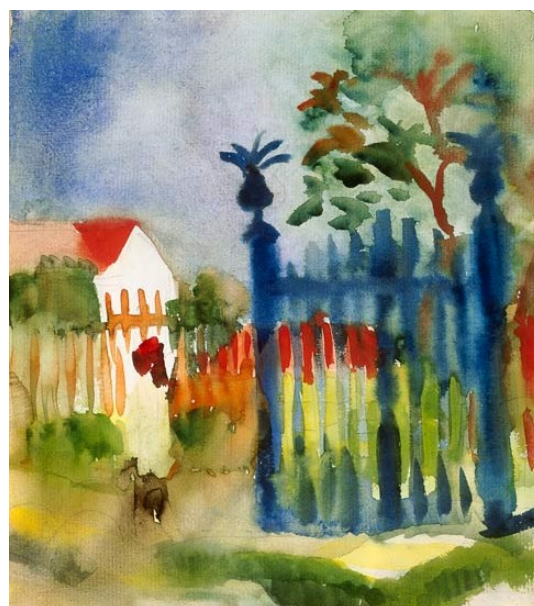
Gartentor, August Macke (1914)