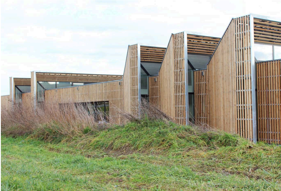
Figure 7. Maison de santé de Void-Vacon (55).