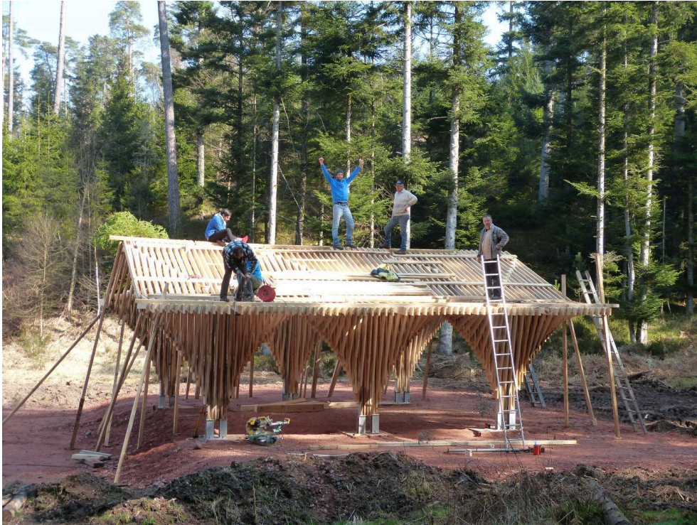
Studiolada (Christophe Aubertin)