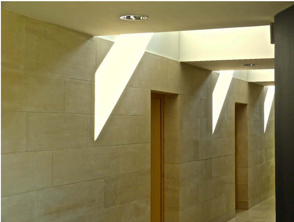
Studiolada (Christophe Aubertin)