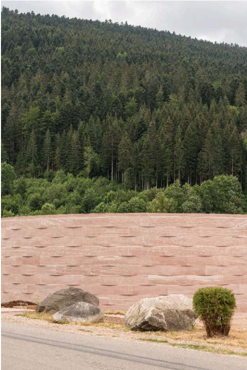
Studiolada (Christophe Aubertin)