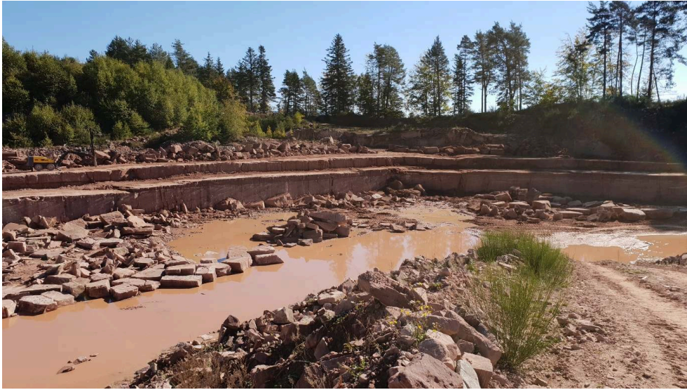
Studiolada (Christophe Aubertin)