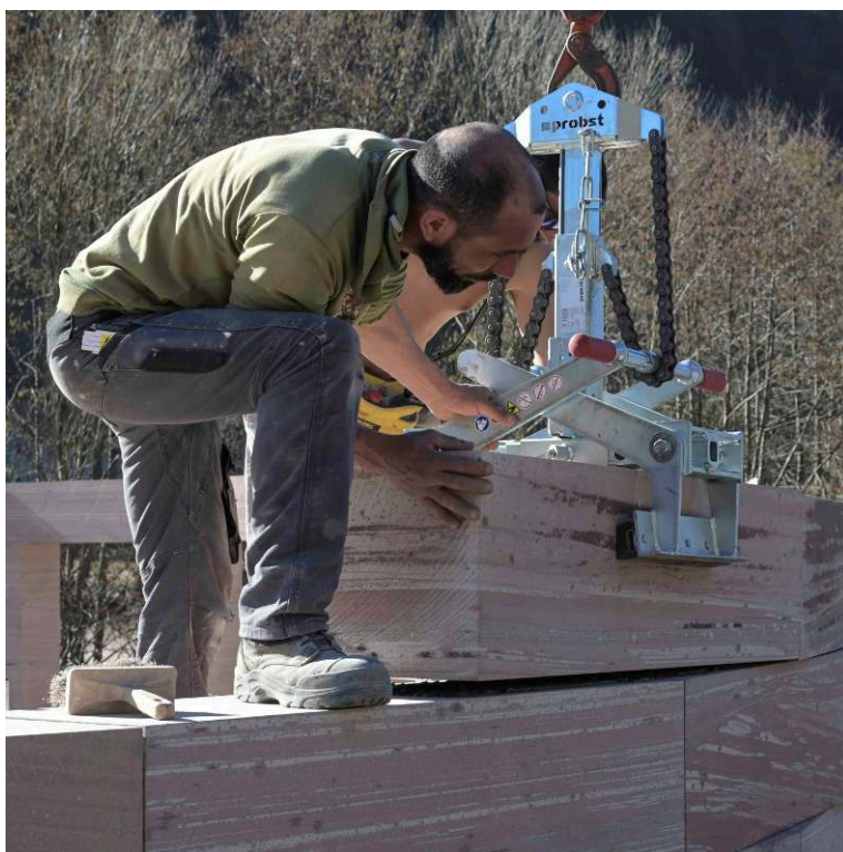
Studiolada (Christophe Aubertin)