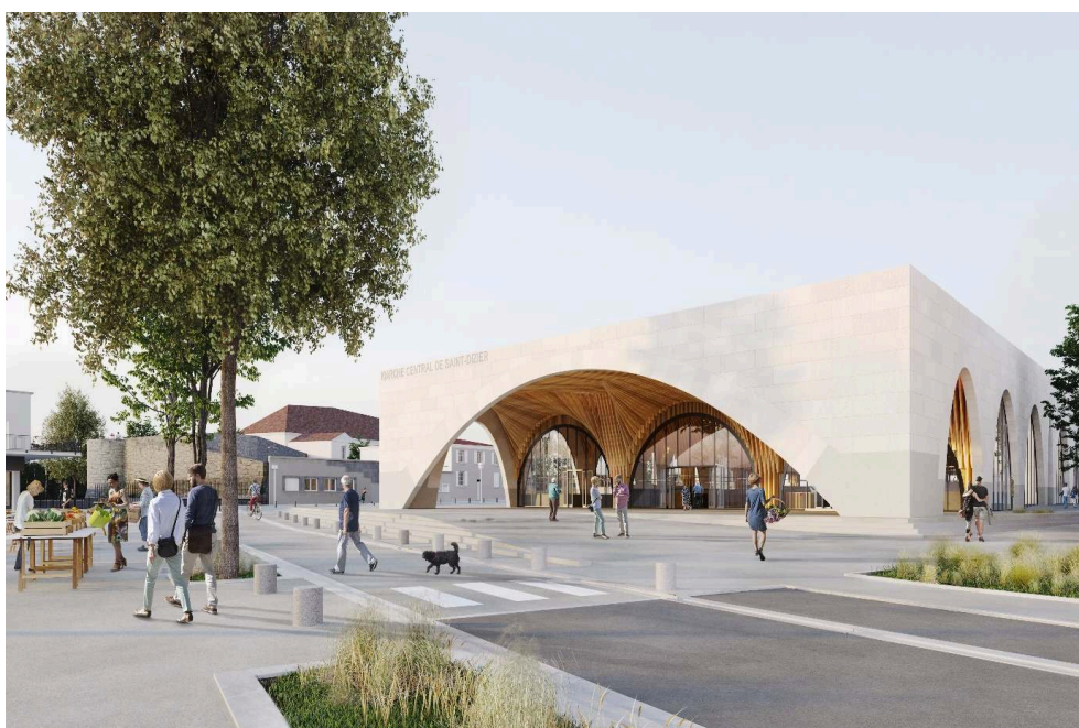
Studiolada (Christophe Aubertin & Aurélie Husson)