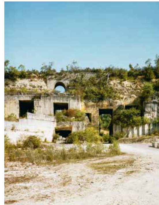
Carrière de pierre de Saint-Vaast-lès-Mello, photographie Giaime Meloni, 2018.

sur cette possibilité voire cette nécessité d'une architecture métropolitaine réellement écologique, saine . « Saine », tout d'abord, car sincère : j'entends par là qui se refuse au simulacre écologique, à savoir qui renonce à s'afficher comme l'opération écologique qu'elle n'est pas. Rappeler cela n'est ni anodin ni évident, à l'heure où se multiplient les nouvelles constructions en béton armé et polystyrène recouvertes avec du bardage bois, les potagers au balcon, les enduits rappelant la terre crue, et même la peinture verte ici et là. Les architectes doivent en revenir aux fondements de leur discipline, qui est tout sauf de bâtir du simulacre. Tout au contraire, et sans avoir à revenir à l'archaïque, la discipline architecturale, même la plus moderne, est truffée de formidables outils et de courants historiques remarquables capables d'aider les architectes souhaitant mettre en valeur la vraie nature constructive, matérielle, structurelle, systémique de leur œuvre (beaucoup ne l'ont d'ailleurs pas oublié). Auguste Perret avait pour coutume de dire que « l'architecture, c'est ce qui fait de belles ruines 14 ». Je dirai aujourd'hui à sa suite que « l'architecture écologique ne change pas de nature en devenant ruine ».