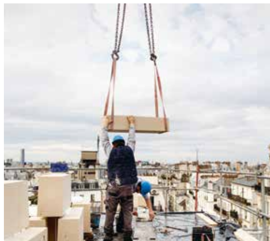
Chantier de l'immeuble du 92, rue Oberkampf, Paris 11 e , Barrault Pressacco, architectes, 2017.