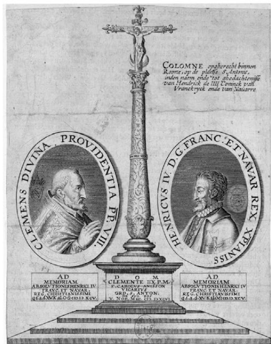
FIG. 10. – Paris, BnF, Estampes, RÉSERVE QB-201 (11)-FOL<p. 76>, IFN- 8401103, portraits du pape Clément VIII et du Roi Henry IV, aux deux côtés d'une colonne terminée par une croix, fin XVI e -début XVII e s.