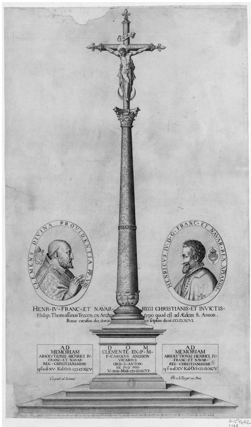
FIG. 7. – Paris, BnF, Estampes, RÉSERVE QB-201 (11)-FOL<p. 74>, « Portraits du pape Clément VIII et du Roi Henry IV, aux deux côtés d'une colonne terminée par une croix », 1596.