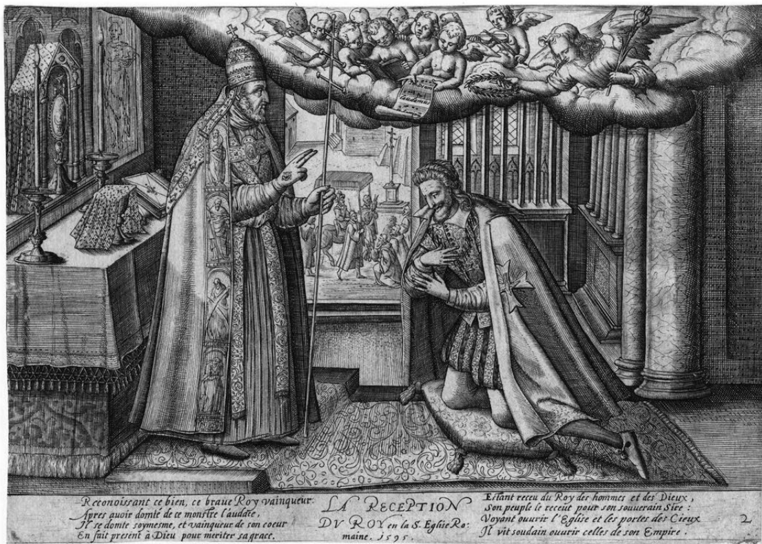
FIG. 2. – Londres, The British Museum, Prints & Drawings, 1872,1012.898, estampe « La réception du roy en la s. Eglise romaine ».