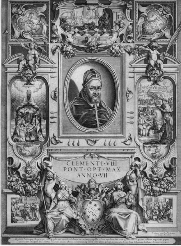
FIG. 3. – Londres, The British Museum, Prints & Drawings, R, 7.73, estampe figurant le portrait de Clément VIII en buste entouré de cinq scènes avec les œuvres majeures de son pontificat, 1599.

l'entrée triomphale à Ferrare, passée sous contrôle de la papauté en 1598. En bas à gauche, l'Église ruthène se soumet au pape ( Magnus Dominus , 1595) et à droite Clément VIII donne au général Giovanni Francesco Aldobrandini le bâton pour combattre le Turc. Enfin, dans un endroit particulier, au milieu en haut, nous pouvons apercevoir l'absolution d'Henri IV à Rome. Ce n'est pas par hasard si la scène la plus humiliante de la cérémonie fut choisie pour commémorer l'événement qui, selon Pastor, donne de l'importance historique au pontificat de Clément VIII : la réconciliation avec le roi de France 36 .