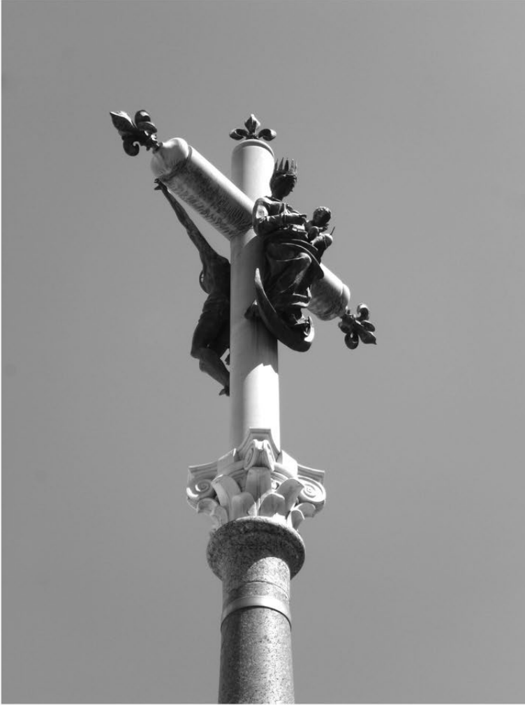
FIG. 6. – Rome, détail de la colonne d'Henri IV, cliché L. Martysheva, 2013. © L. Martysheva.

1,60 mètre porte un Christ de bronze et de l'autre la Vierge couronnée posée sur le croissant et tenant dans ses bras l'Enfant Jésus (fig. 6). Les faces du piédestal portent les armes d'Henri IV, de Clément VIII et de Benoît XIV avec une inscription récente commémorant le transfert 68 et une autre sur la restauration qui remplace celle qui rappelait l'absolution : D.O.M. | CLEMENTE VIII PONT. MAX | AD MEMORIAM | ABSOLUTIONIS HENRICI IV | FRANC. ET NAVAR. | REGIS CHRISTIANISSIMI | Q.F.R.D. XV. KAL. OCT. MDXCV.