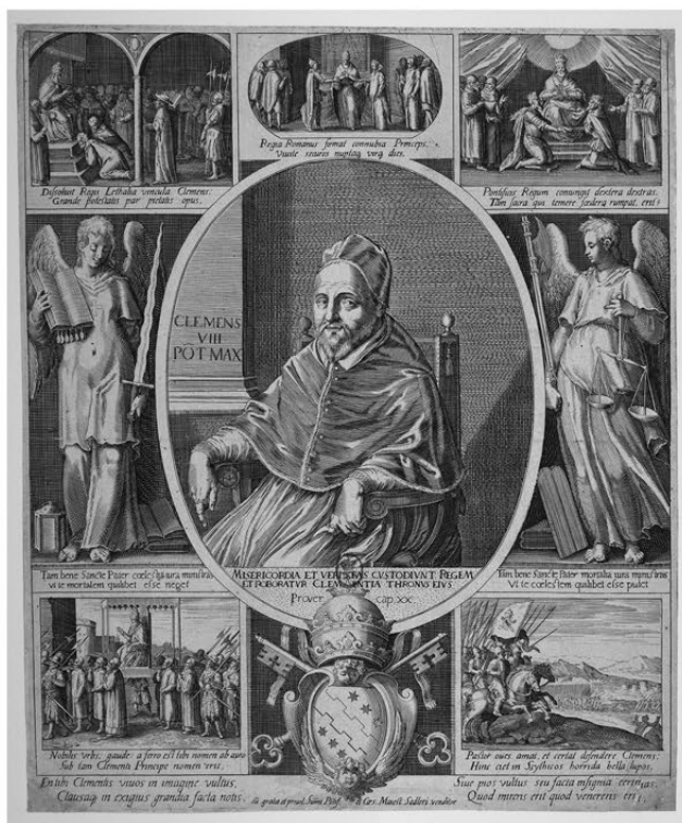
FIG. 4. – Paris, BnF, Estampes, QB-1 (1605/1610-05)-FOL, MFILM M-88581, estampe figurant le portrait de Clément VIII assis entouré de cinq scènes avec les œuvres majeures de son pontificat, fin xvi e -début xvii e s.

Francesco Villamena publia cette gravure « avec le privilège du pape » et très probablement en anticipation du Jubilé de 1600, soigneusement préparé par le pontife 39 . Cette iconographie eut vraisemblablement un certain succès et nous connaissons une autre estampe qui fait l'éloge de Clément VIII attribuée également à Arconio et Villamena (fig. 4). Nous y voyons aussi la