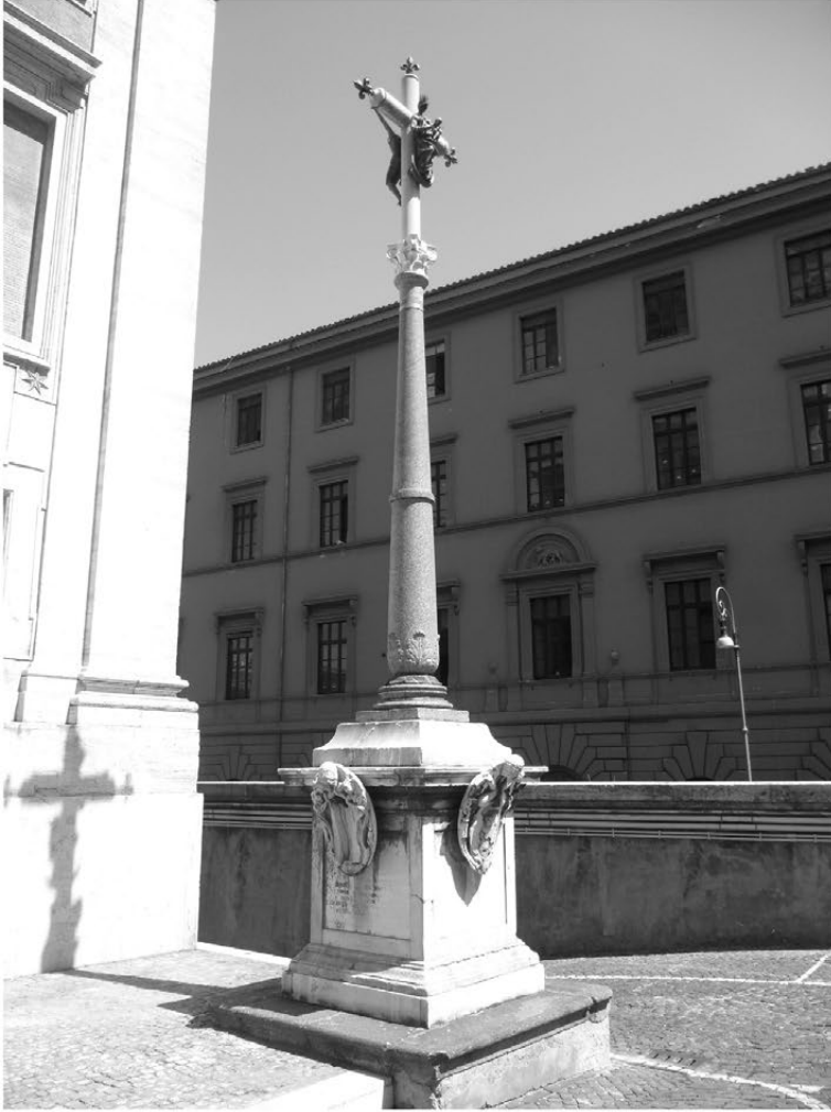
FIG. 5. – Rome, colonne d’Henri IV (1596), vue contemporaine, cliché L. Martyshcheva, 2013. © L. Martyshcheva.

de la rue, la colonne fut enlevée pour être ensuite placée dans une cour intérieure de Sainte-Marie-Majeure 66 .