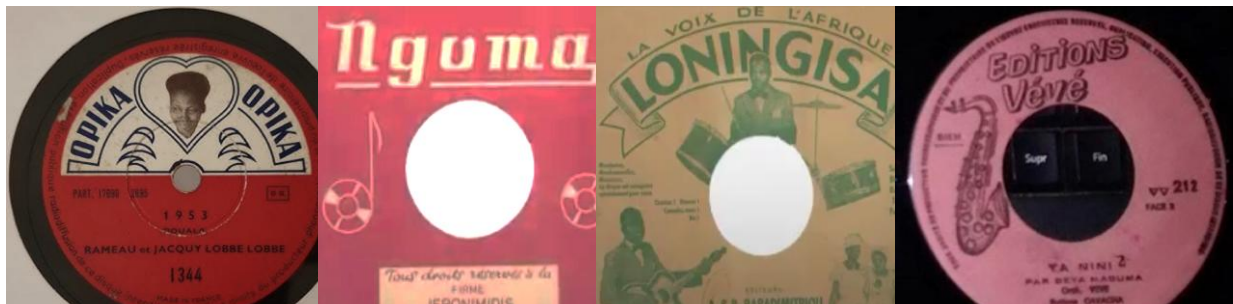
Figure n°3: Les premières maisons d'éditions de disque des années 1950-1970