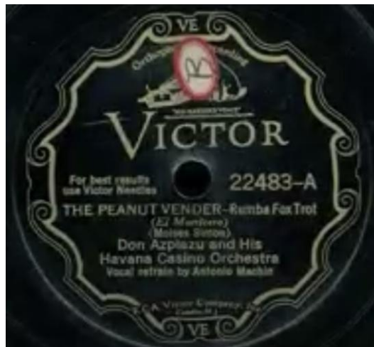
Figure n°1: Le disque de 78 Tours de la Havana Casino Orchestre « Rumba cubaine » des années 1920

La Meringué est un genre musical et une danse née en République Dominicaine (région de Cibao) vers 1850. Elle serait issue d'une danse cubaine créée vers 1830, appelée la Upa habanera qui comportait un pas de danse appelé Merengué . Elle pourrait également provenir d'un rythme nommé Mangulina , genre musical latino-américain ou catalan de Palafrugell. La Merengué se danse en couple; les danseurs exécutent des mouvements sensuels, tournent en rond au rythme de la musique jouée par des instruments tels que l'accordéon, le tambour et le saxophone. Sa zone d'influence s'étend de Porto Rico, aux USA, à la région caribéenne jusqu'aux autres pays de l'Amérique latine (Venezuela et Colombie). Les chansons incluent maintenant des trompettes, des saxophones et ont de véritable orchestre. La Merengué dominicaine se danse sur un rythme de 4/4 et le pas de base se réalise sur 8 temps, chacun des temps représentant un pas réalisé par les danseurs qui sont face à face et effectuent les