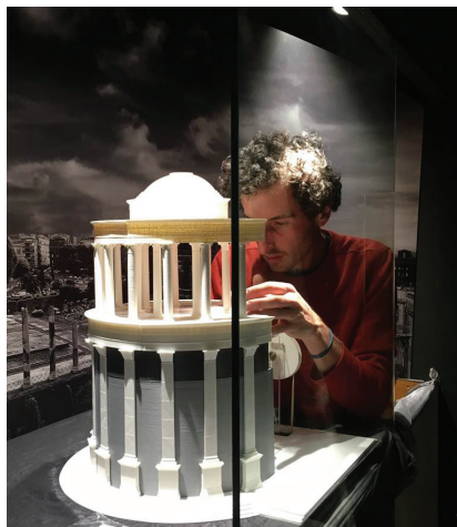
FIG. 8 a. – Maquette de la coenatio rotunda réalisée pour l'exposition sur Le banquet, de Marseille à Rome (musée archéologique de Marseille, 3-12-2016/30-6-2017).