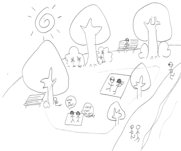
Dessin de I.