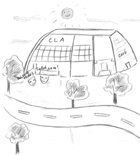
Dessin de S.

C'est ce qui va permettre à l'étudiant en mobilité de se représenter l'espace qui l'entoure de manière beaucoup plus apaisée.