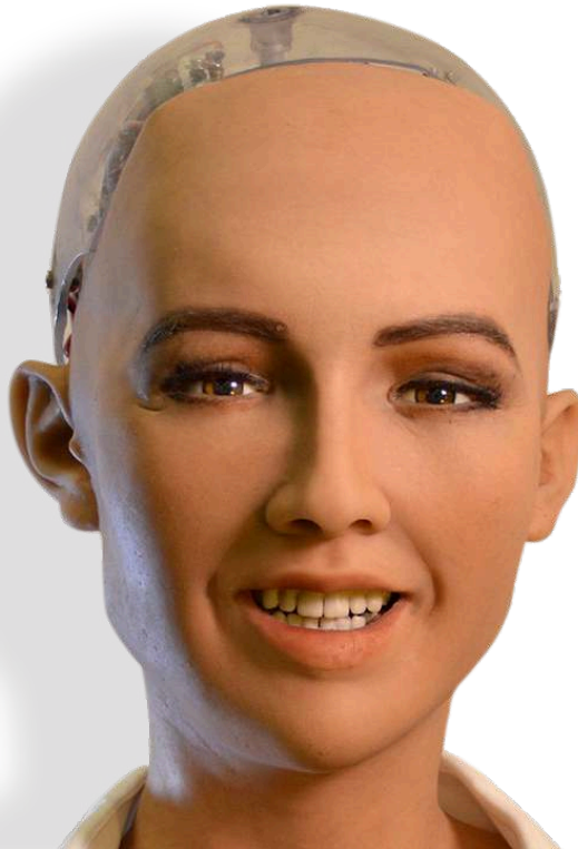
Figure : Visage de SOPHIA