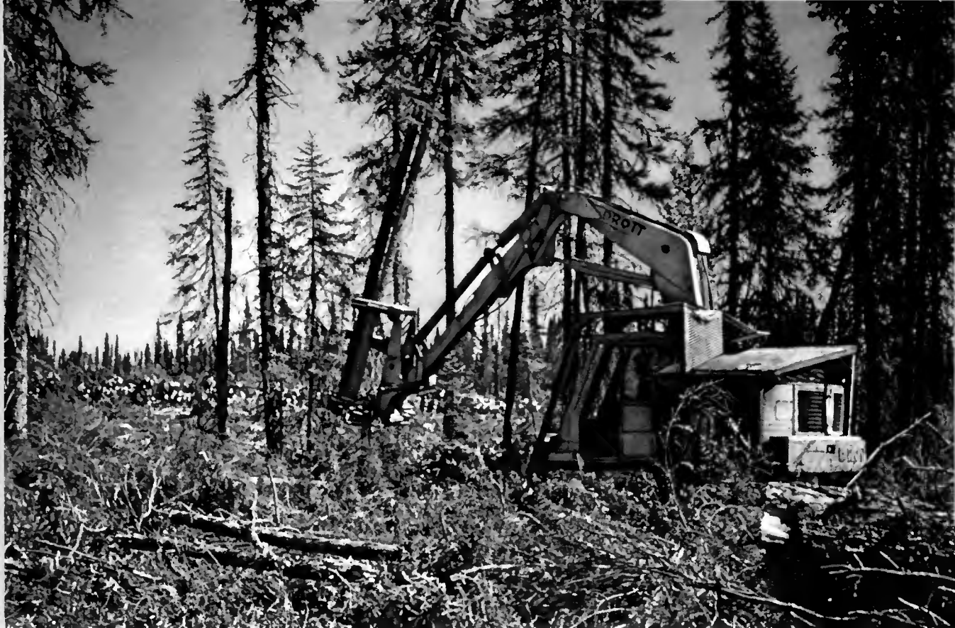
Les quantités enlevées totales de bois en Europe ont augmenté de 51 millions de m 3 entre 1950 et 1970...