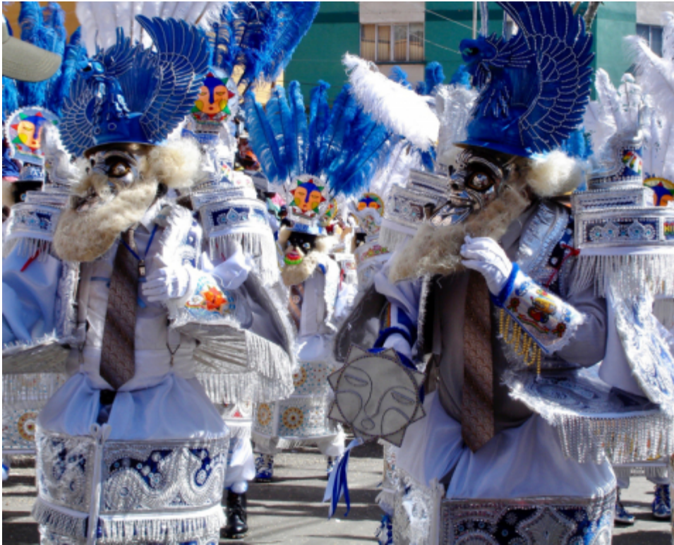
Cliché Laura Fléty, La Paz, Bolivie, 2015

Chez les hommes, on ne danse bien que si l'on sait porter et faire bouger son costume avec une grande force musculaire. Le mouvement ne peut surgir et être rendu visible que si le danseur sait agiter avec précision les rubans ou les franges de perles qui bordent son costume-carapace, en périphérie du corps. La qualité de la danse repose autant sur les mouvements corporels que sur la texture, l'éclat et l'impact visuel des matières qui recouvrent et transforment les danseurs, devenus des « corps-objets » amplifiés et ostentatoires. La compréhension de la complexité de l'organisation sensible et de la nature des actes dansés passe ici par l'exploration de la relation du corps dansant avec les matérialités qui le transforment et le rendent saillant (Fléty, 2015).