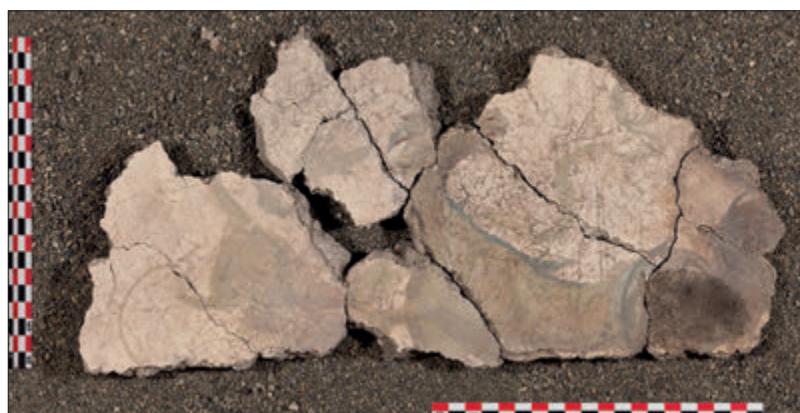
Tav. XL – 1. Marina di S. Nicola (Ladispoli-RM). Proposta di ricostruzione della composizione del soffitto (elab. autori); 2. Marina di S. Nicola (Ladispoli-RM). Porzione dell'intonaco: riquadro con delfino, pianta e quarto di cerchio (foto T. Crognier); 3. Marina di S. Nicola (Ladispoli-RM). Porzione dell'intonaco: ippocampo e mostro marino (foto T. Crognier).