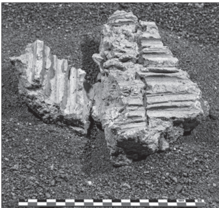
Fig. 2 – Villa di Marina di S. Nicola. Angolo rientrante e inversione d'orientamento dell'incannucciata.

entrambi su fondo bianco, separati tra loro da una profilatura di colore rosso bordeaux . Dello stesso colore e spessore è la linea perimetrale che incornicia il soffitto nella sua interezza e su cui si imposta la linea divisoria tra i due moduli ( Tav. XL.2 ) 6 . Questi si caratterizzano come segue: il modulo sud è composto da uno schema simmetrico a partire da un cerchio centrale, ripartito su due livelli: una prima fascia interna, composta da una corona dentellata di colore rosso; una seconda fascia esterna, formata da una sequenza di ghirlande vegetali legate da nastri. Da queste ghirlande pendono a raggi, in corrispondenza degli angoli della campitura, quattro festoni vegetali stilizzati di colore verde scuro. È verosimile pensare che all'interno