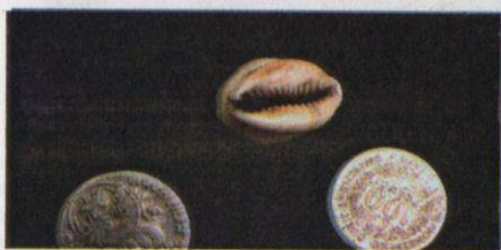
10. Enceinte ( biir )

Ce cauri, dont on n'a pas encore cassé la coquille intérieure, représenterait-il, avec cette enflure, une femme enceinte ? « Enceinte » est signifié autrement ; mais le hasard n'existant pas ici, on peut supposer, vu la forme du cauri, que cette est enceinte.