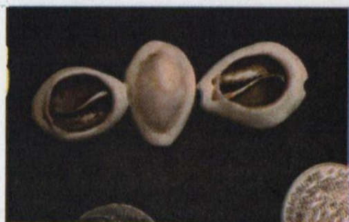
9. « Mangeuse d'âme » ( dëmm )

Une figure, qui est présentée comme un être avec des ailes — les dëmm sont censées en avoir et en usent la nuit pour se déplacer —, mais qui peut aussi être considérée comme deux bouches — organes de « dévoration » — dirigées de chaque côté d'un individu, le cauri du milieu, qui se trouve être ici une femme, représente le dëmm . Ces deux bouches « mangent », mieux, phagocytent littéralement cette femme. Elles sont plaquées sur elle avec une évidente avidité de succion, ce qui est signifié par cette proximité des bouches sur le corps de leur proie, de leur victime.