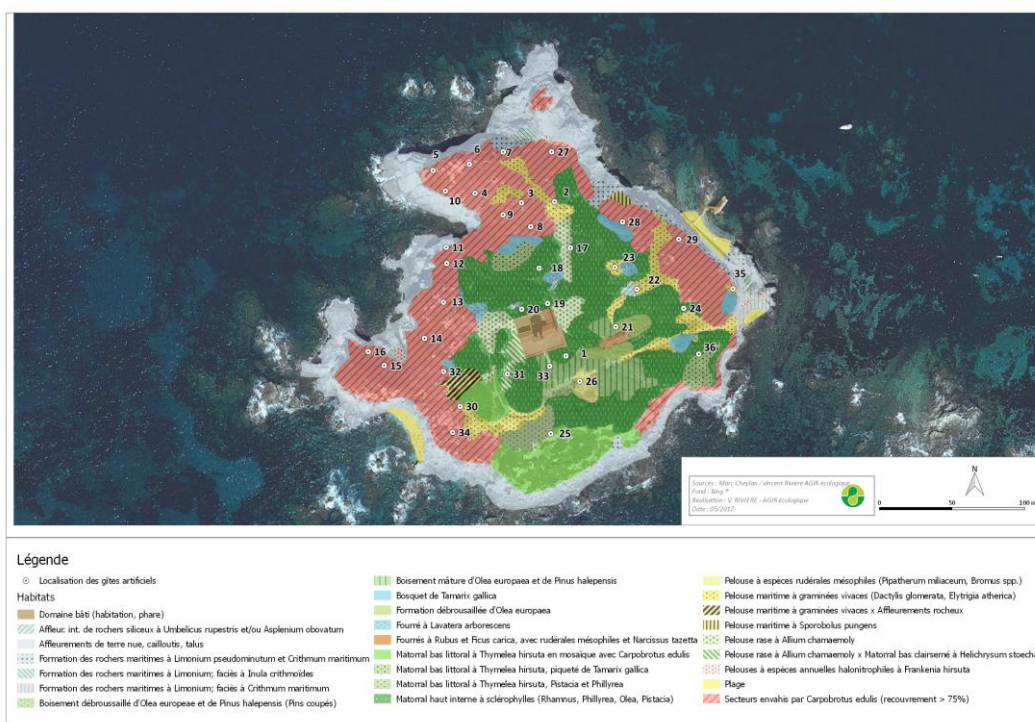
Figure 2.— Localisation des gîtes sur la carte des habitats.

dans certaines conditions tout au moins, mais également un moyen d'accroître ses effectifs. Dans un premier temps (mai 2013), deux types de gîtes ont été testés : l'un constitué de briques alvéolées, l'autre de trois tuiles rondes (dites « romaines »), empilées les unes sur les autres, avec un léger espace entre chacune, maintenu par la pose de petites plaquettes de pierre de l'épaisseur approximative d'un Phyllocladyle (2 à 5 mm). Dans les deux cas, les gîtes ont été largement recouverts de pierres, à la fois pour les dissimuler à la vue, mais aussi pour assurer un bon tampon thermique au-dessus et autour du dispositif (Fig. 1). 32 gîtes ont été posés sur l'ensemble de l'île les 5 et 6 mai 2014 (Fig. 2), de façon à couvrir équitablement le territoire mais aussi de manière à prendre en compte les principaux habitats naturels présents sur l'île. Au cours du temps, 4 gîtes ont été détruits ou systématiquement chamboulés par le public fréquentant l'île. Ils ont été remplacés en 2016 par 4 nouveaux sites disposés dans des lieux moins accessibles ce qui mène à 34 gîtes opérationnels en 2017. Chaque gîte est géolocalisé au GPS et numéroté par un chiffre écrit sous la tuile supérieure.