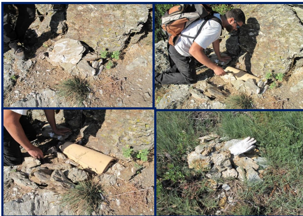
Figure 1.— Étape de la mise en place d'un gîte.

Compte tenu de ces éléments et dans le but de limiter les contraintes techniques et logistiques, nous avons testé sur l'île du Grand Rouveau la méthode des gîtes artificiels, en vue de mettre en place un suivi à long terme de cette population.