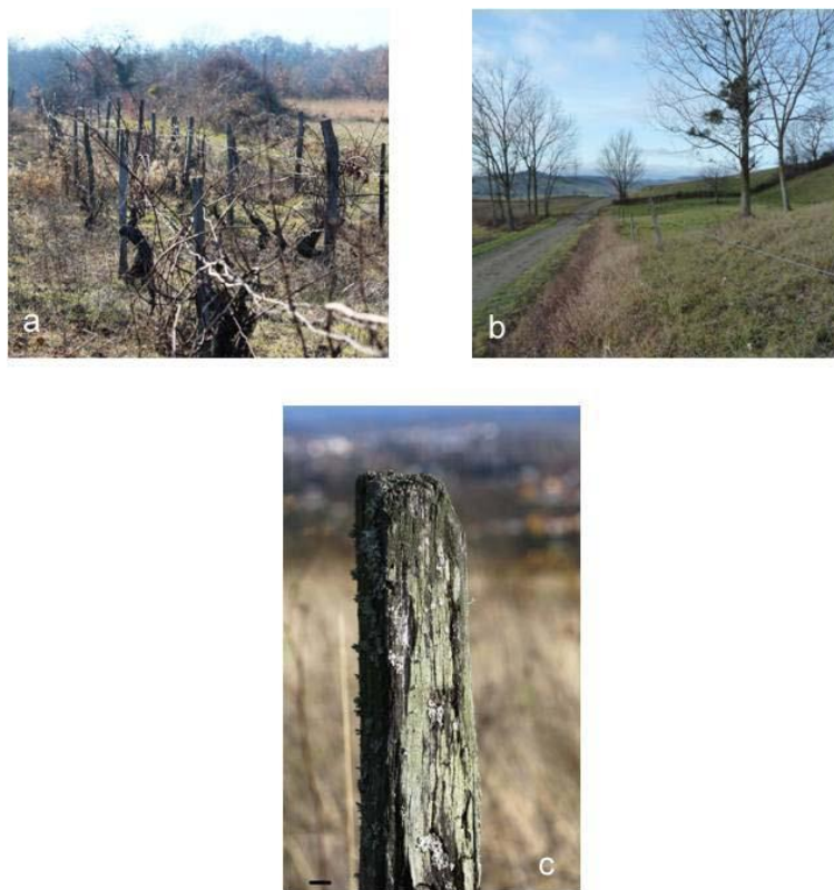
Figure 2.— (a) : exemple de piquets de vignes à l'abandon de Malauzat. (b) : exemple de piquets de clôture en bordure de route départementale. (c) : sommet de piquet prélevé (échelle 1 cm).

Les paramètres phytosociologiques calculés sont :