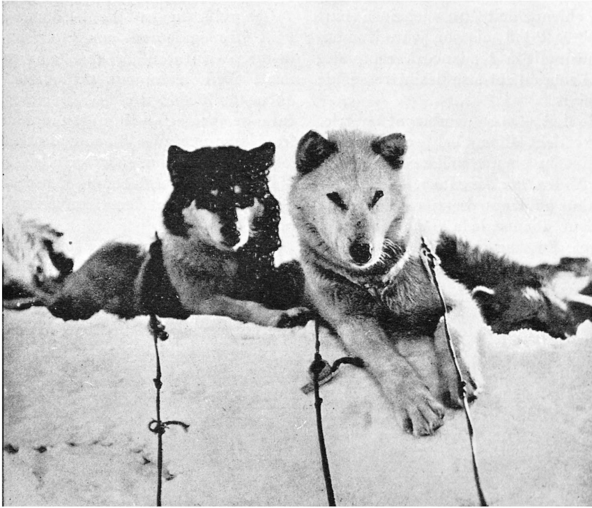
Chiens de la côte Ouest.

Pour ma part, je préfère les chiens nés en été, qui se développent mieux, sont en général plus grands et plus