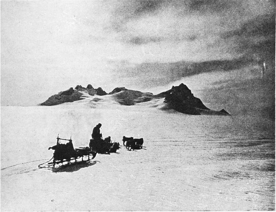
En traineau dans la région montagneuse inconnue de bordure de la côte Est, explorée pour la 1 re fois en juin 1937.

boules de glace se forment rapidement, boules de glace qui ont parfois presque la grosseur du poing et qui pendent et ballottent tout autour du corps du pauvre chien qui en est gêné dans sa course, alourdi, et dont les poils ne le protègent plus contre le froid.