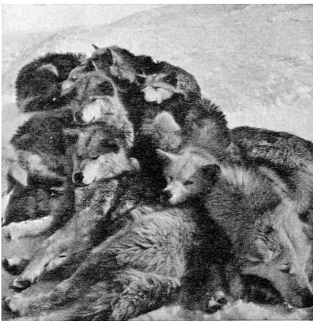
Famille de chiens eskimo de traîneau de la côte Ouest du Groenland.

S'ils mangent à leur guise toute la journée, ils se développent vite et bien. Un chiot repu est celui qui refuse de manger de la viande. Son petit ventre est parfois tellement plein qu'il a peine à marcher et que, quand il s'assied, il