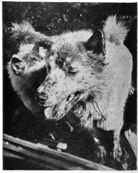
Chien de la côte Est, après une bataille.

En hiver, lorsque la neige est nouvelle, les chiens, qui sont presque toujours attachés, sont relativement propres. Mais dès la fin de mars, quand la neige commence à fondre, et que la graisse de phoque, qui traîne partout autour des huttes eskimo, réapparaît, l'état des chiens devient indescriptible. Leurs poils sont collés au corps par une glue graisseuse, noire, et il est impossible de les toucher sans avoir les mains aussitôt poisseuses et sales. Lors des courses en traîneau, la neige et l'eau restent attachés aux poils, et de grosses