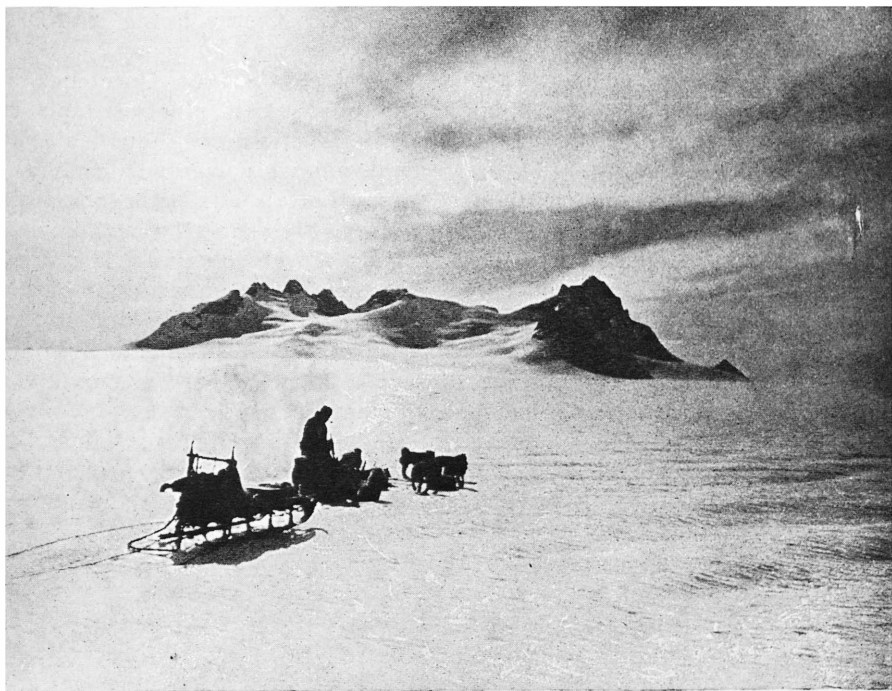
En traineau dans la région montagneuse inconnue de bordure de la côte Est, explorée pour la 1 re fois en juin 1937.

boules de glace se forment rapidement, boules de glace qui ont parfois presque la grosseur du poing et qui pendent et ballottent tout autour du corps du pauvre chien qui en est gêné dans sa course, alourdi, et dont les poils ne le protègent plus contre le froid.