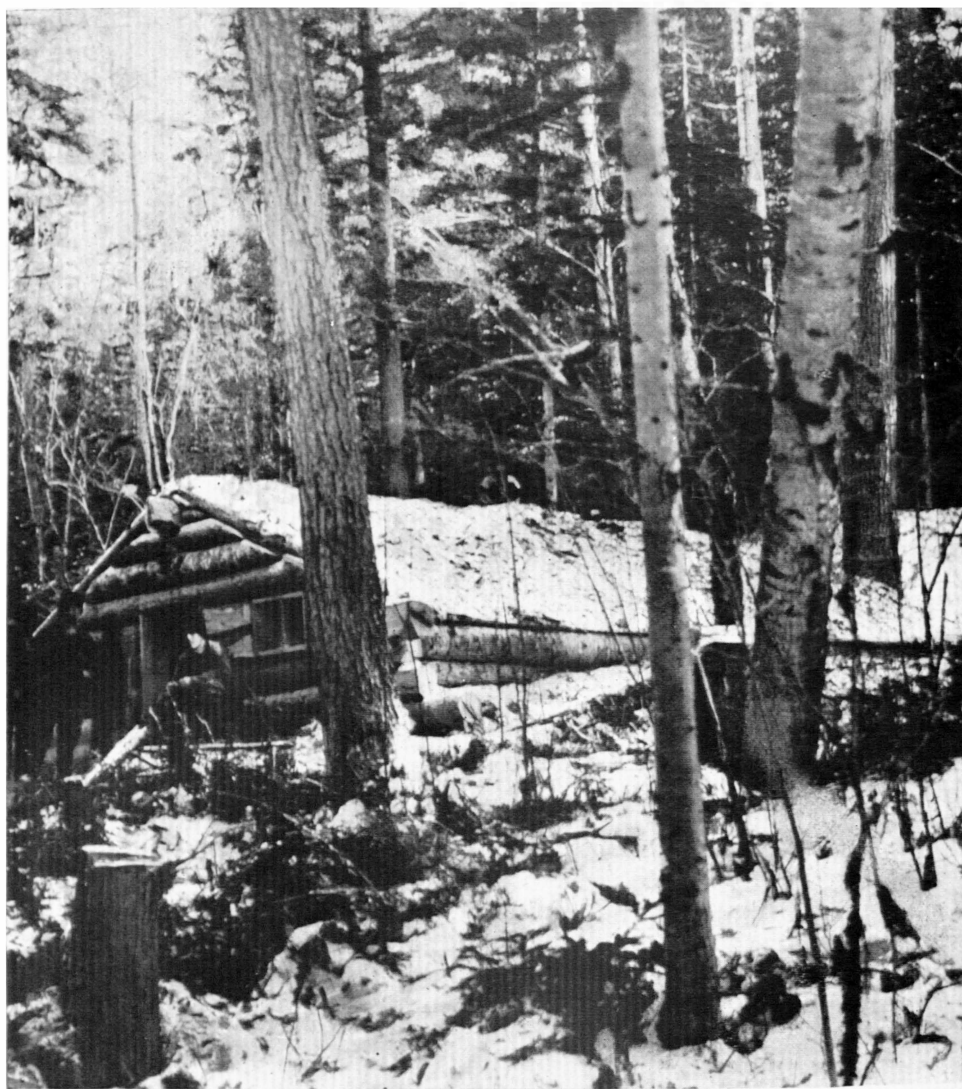
Hutte de prospection pour l'or. Iman (Sibérie orientale).