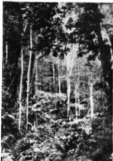
Placer «Souvenir». — Forêt tropicale guyanaise.

deux arbres et se couche à jeun : tel Achille dédaignait Agamemnon. La pluie arrive et le fait lever : le voilà qui construit un toit léger à son hamac avec deux branches et quelques feuilles : il est adroit vraiment.