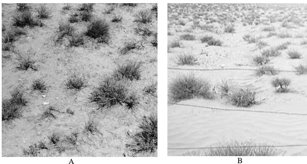
Figure 2.— États de surface en 1975 (A) avec pellicule et en 2005 avec accumulation de sable (B) reconnaissable aux rides (ripple-marks) qu'il forme à la surface.

3). Corrélativement, la pellicule de surface suit une évolution inverse alors que les éléments grossiers augmentent jusqu'en 2005 puis diminuent. En fait, la pellicule de surface n'est pas de même nature au début et en fin de période de surveillance. Elle est composée en majorité de particules fines (limons et argile) au départ, parfois cryptogamique dans la parcelle mise en défens alors qu'elle est sur sable fixé en fin de période.